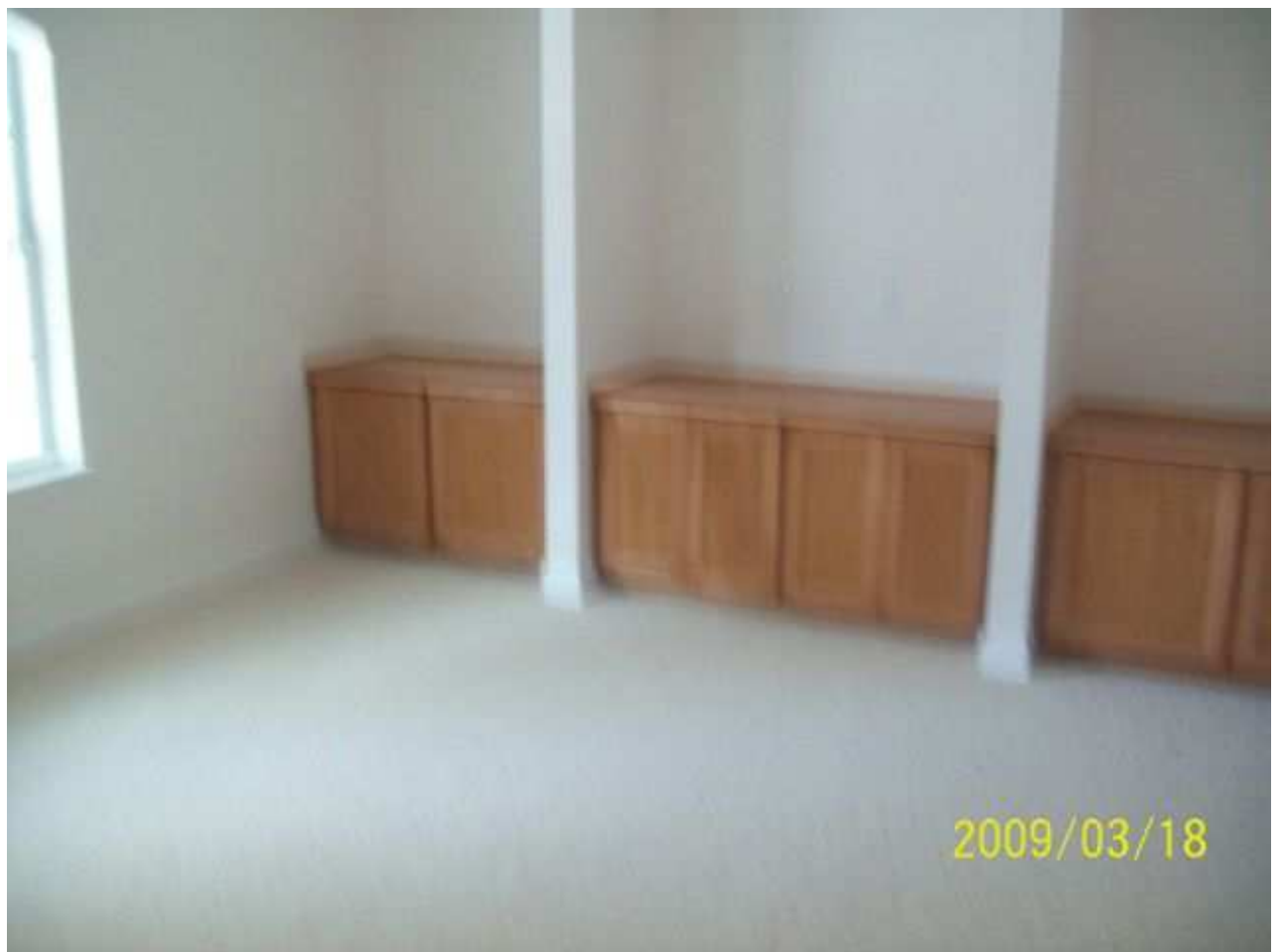
march18 jody 179 [640x480].JPG