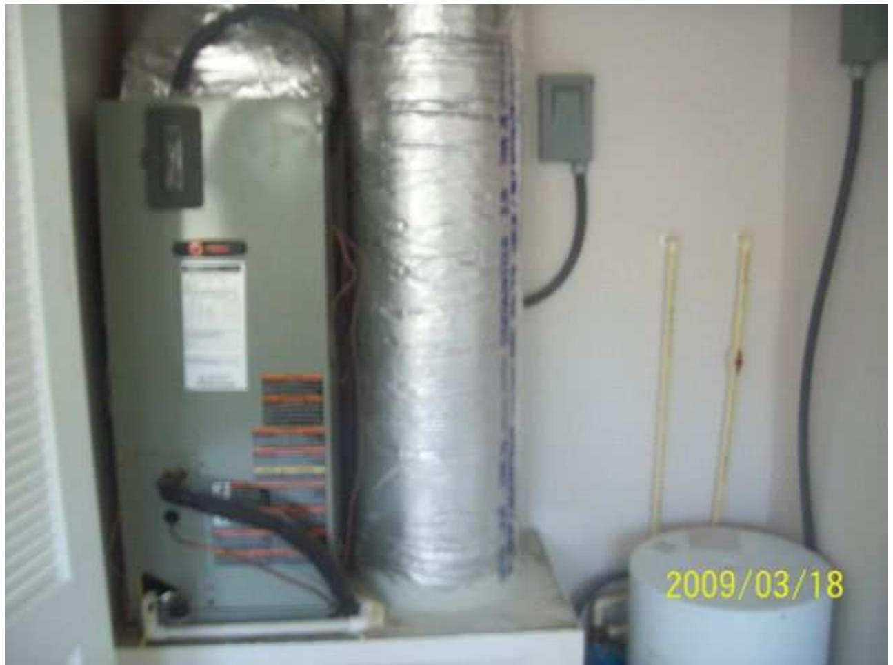
march18 jody 165 [640x480].JPG