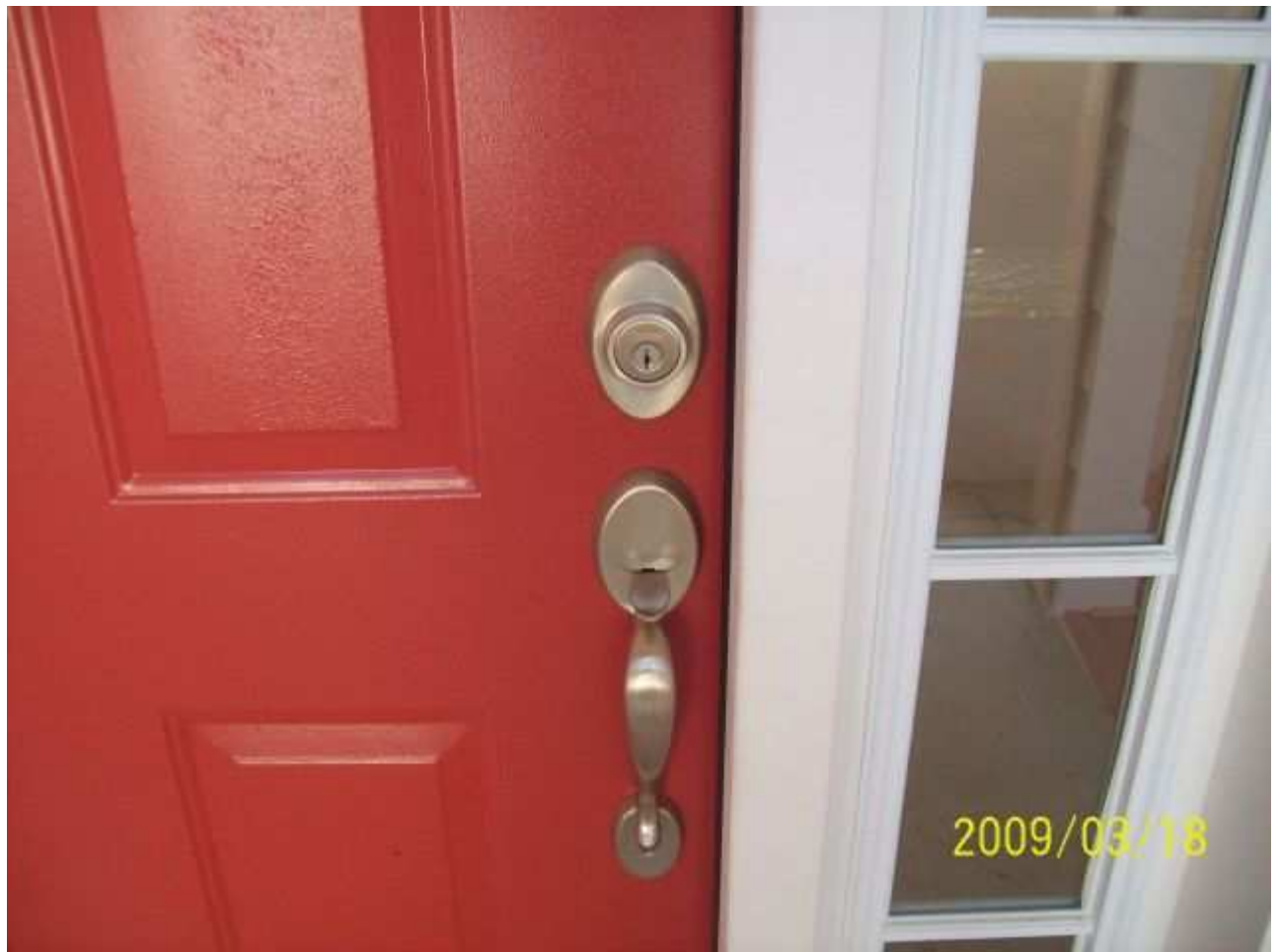
march18 jody 104 [640x480].JPG