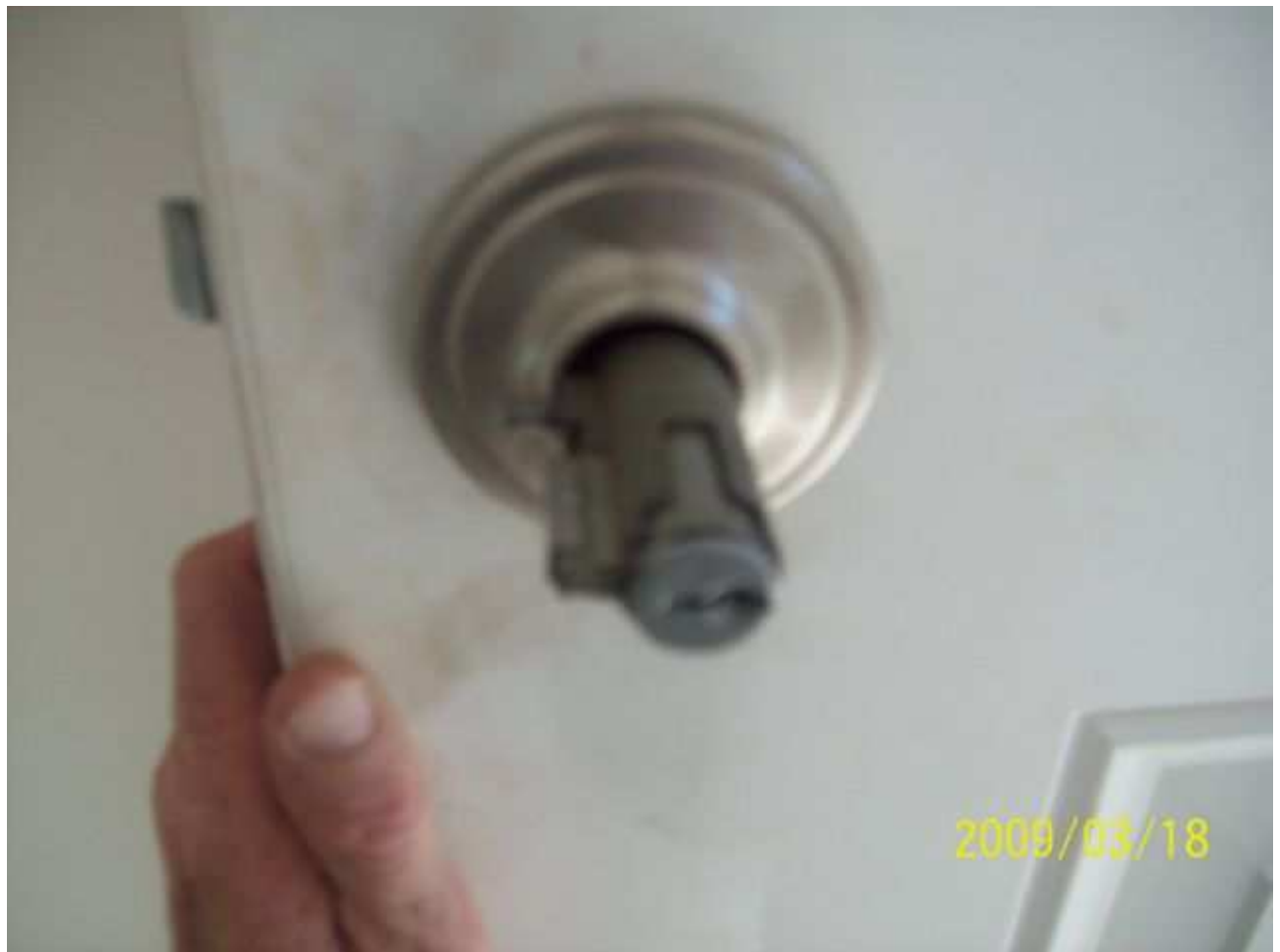
march18 jody 145 [640x480].JPG