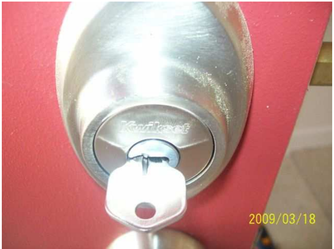
march18 jody 126 [640x480].JPG