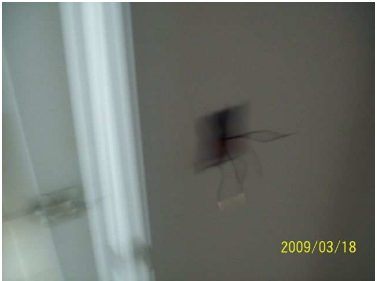
march18 jody 239 [640x480].JPG