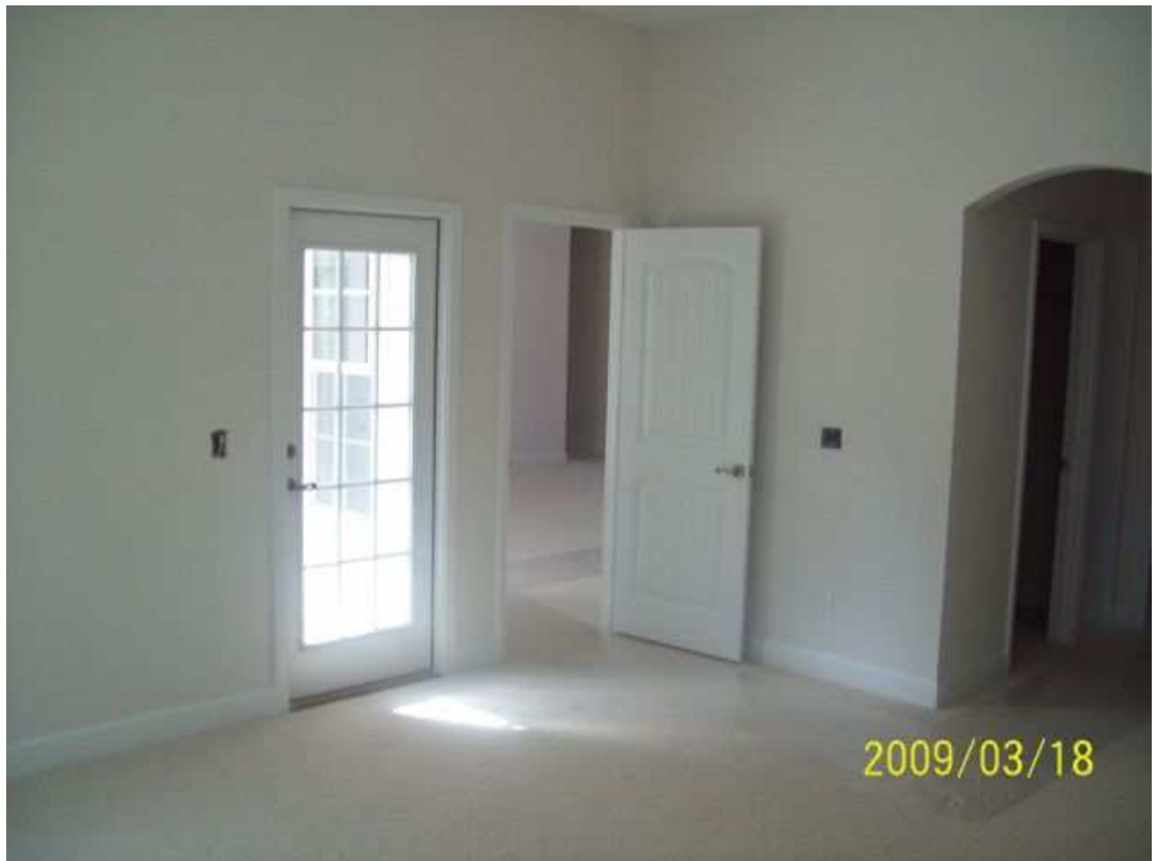
march18 jody 193 [640x480].JPG