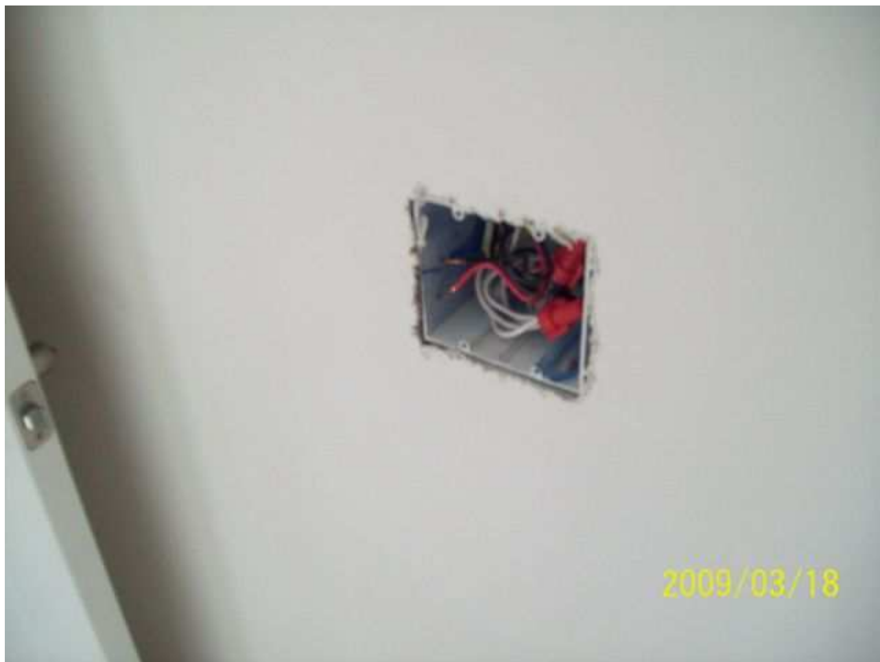
march18 jody 237 [640x480].JPG