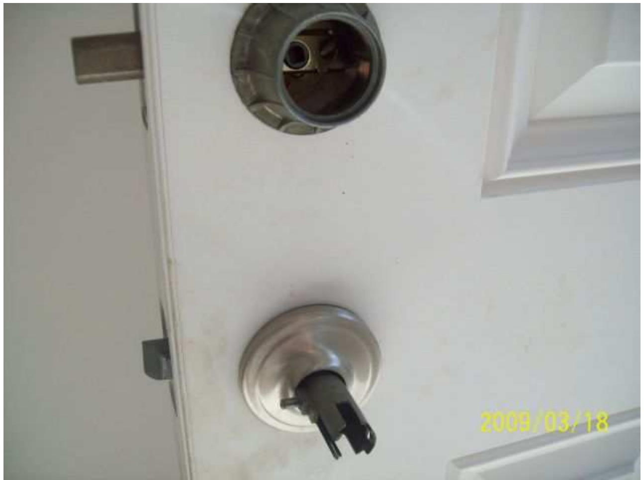
march18 jody 136 [640x480].JPG