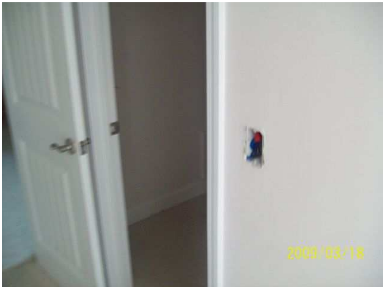
march18 jody 238 [640x480].JPG