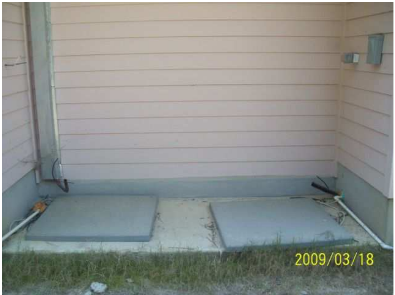
march18 jody 052 [640x480].JPG