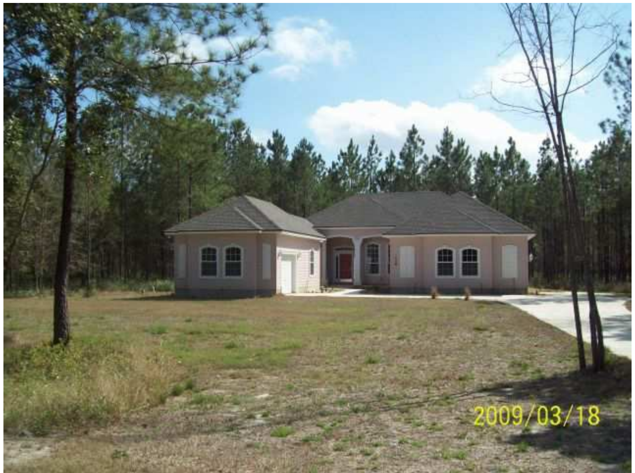
march18 jody 006 [640x480].JPG