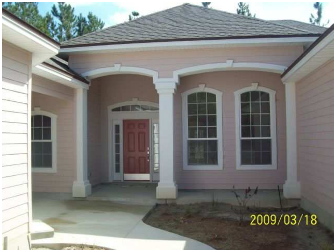
march18 jody 097 [640x480].JPG