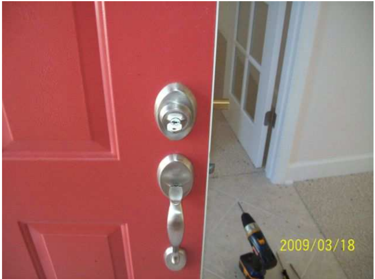
march18 jody 125 [640x480].JPG