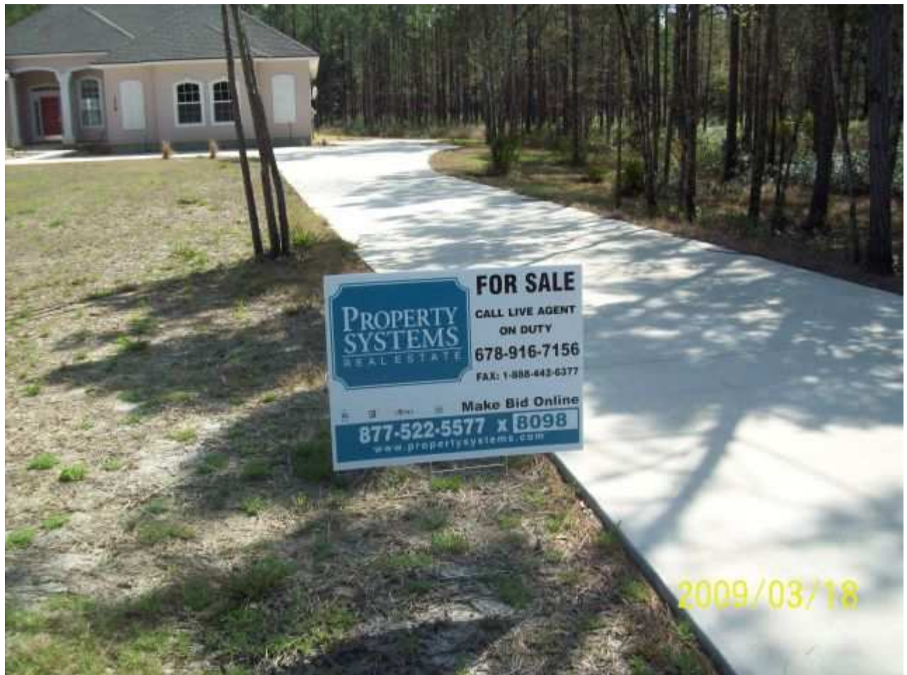
march18 jody 007 [640x480].JPG