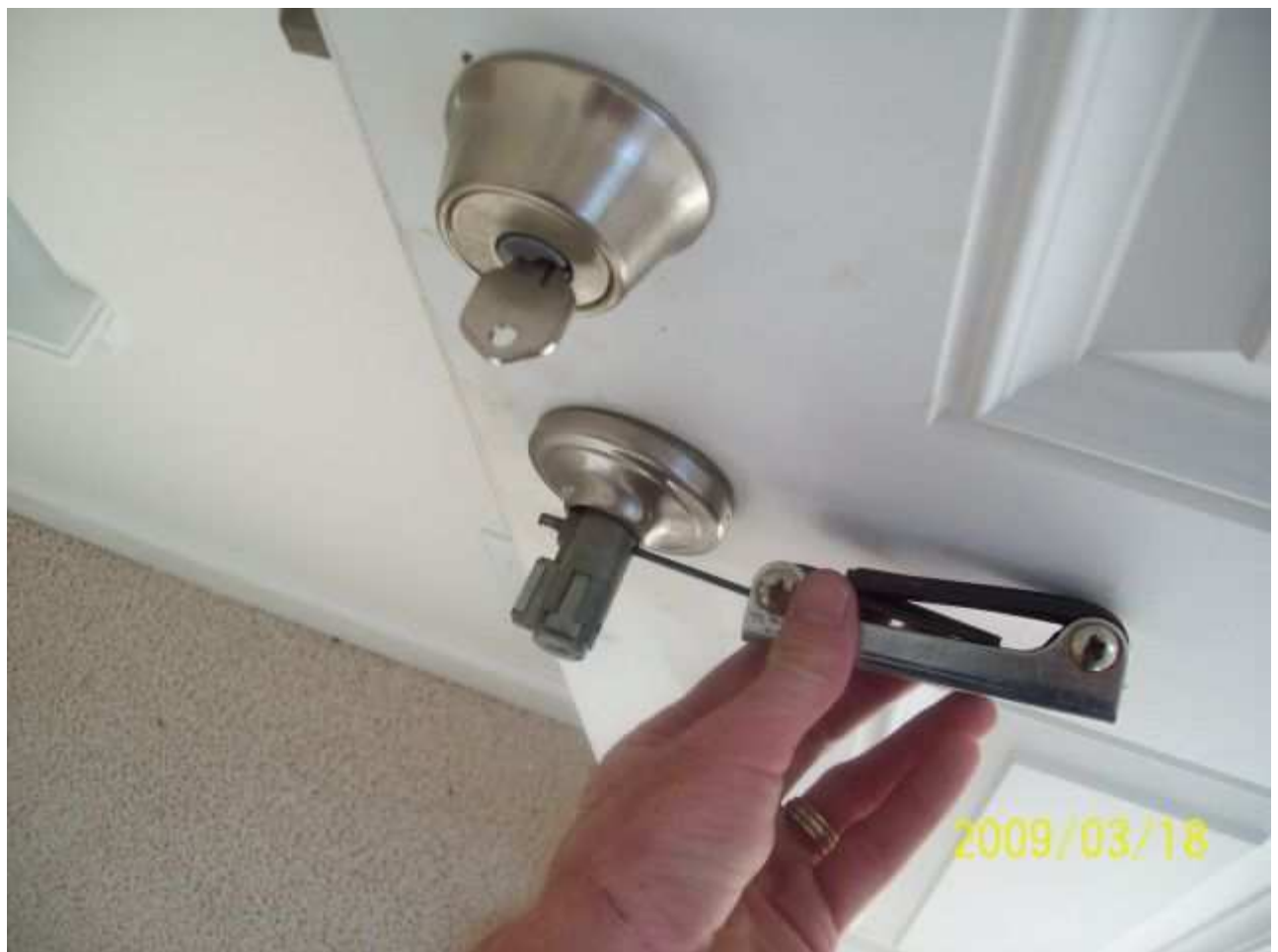
march18 jody 146 [640x480].JPG