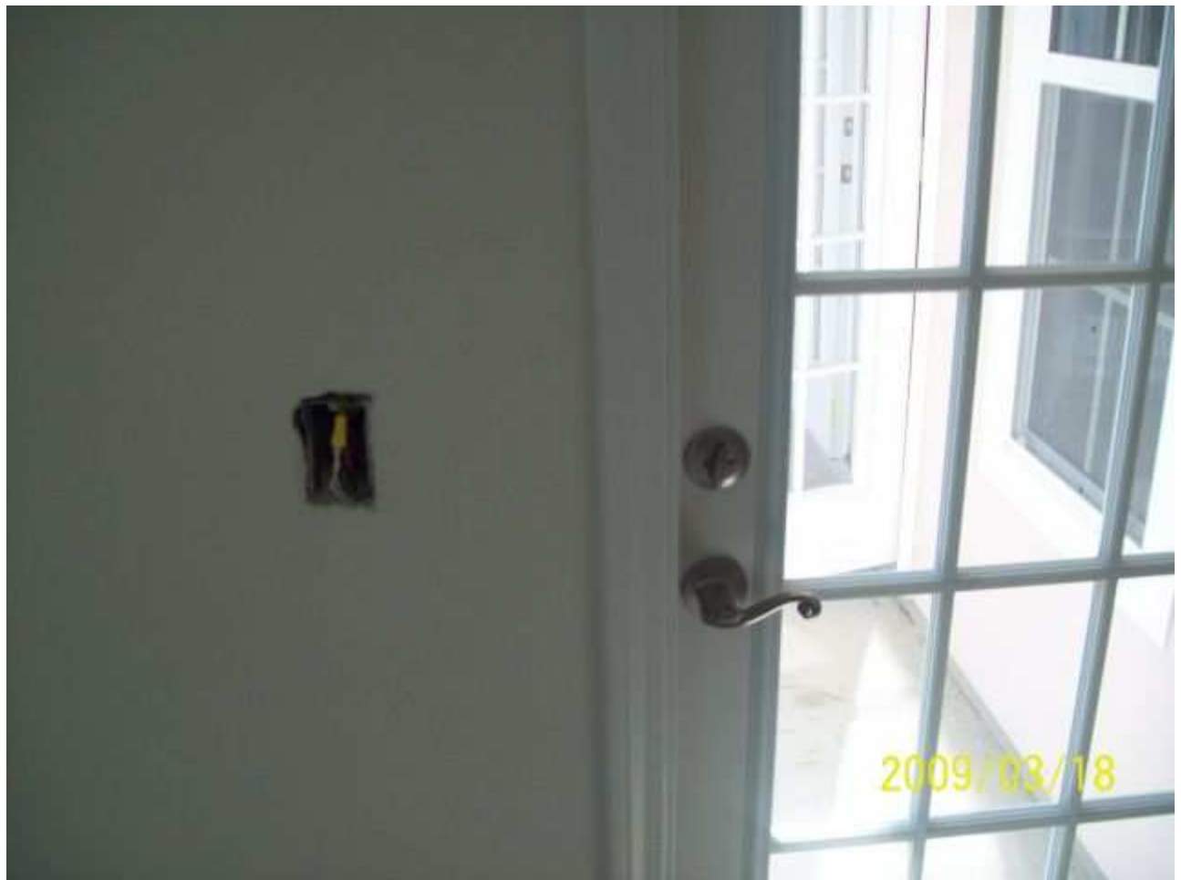
march18 jody 236 [640x480].JPG