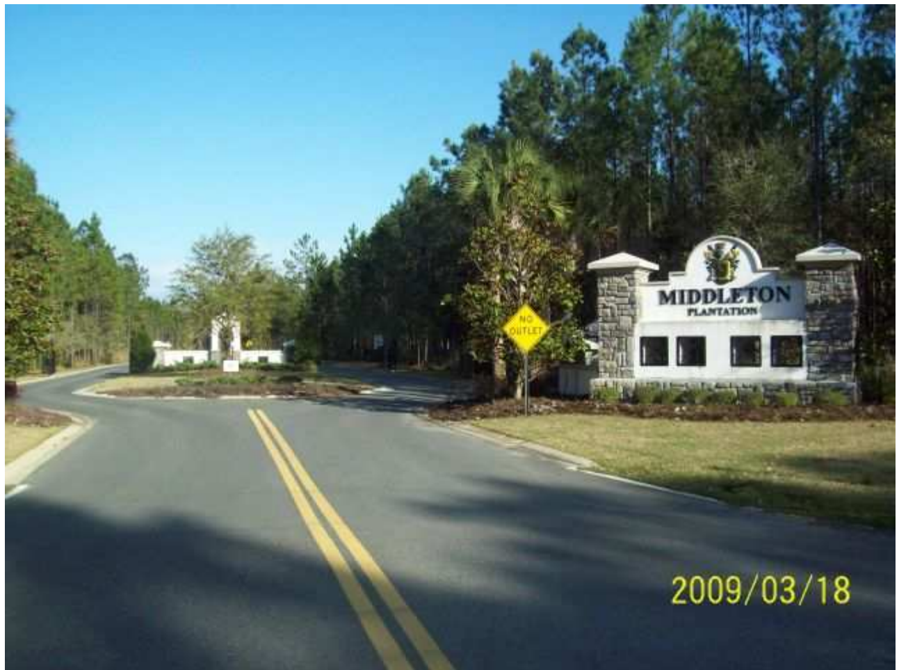
march18 jody 256 [640x480].JPG