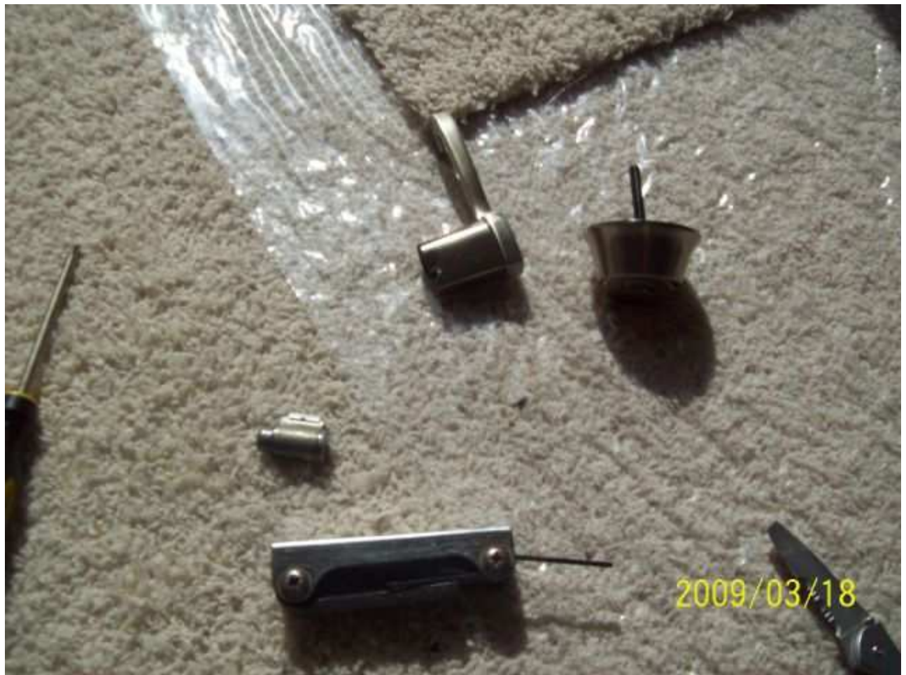
march18 jody 139 [640x480].JPG