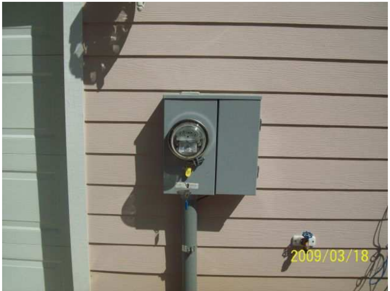
march18 jody 025 [640x480].JPG