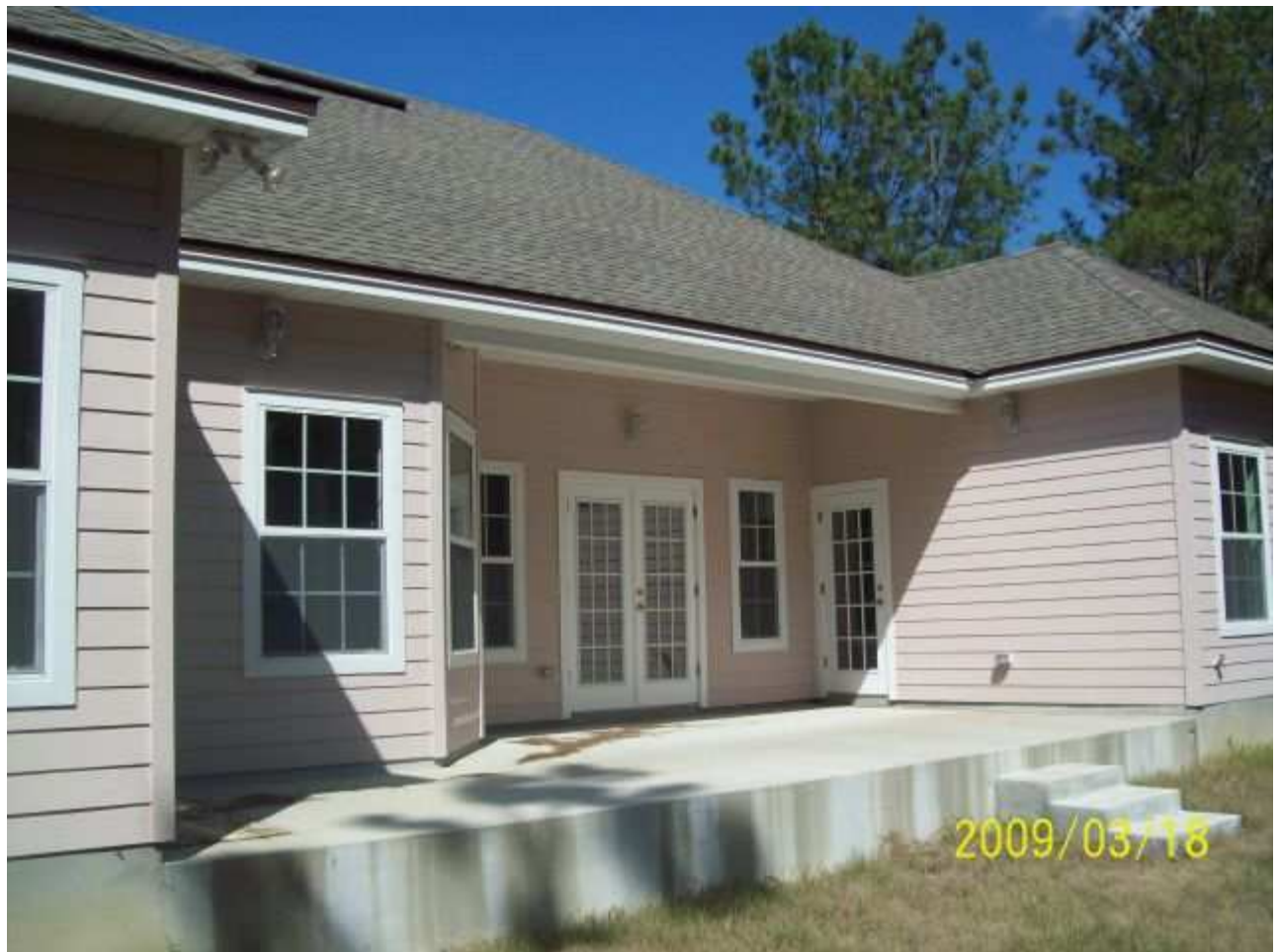
march18 jody 034 [640x480].JPG