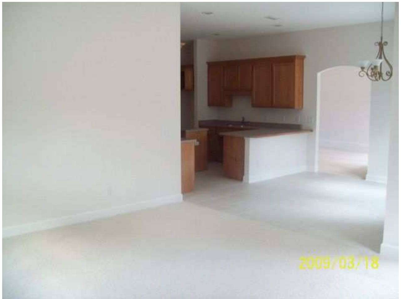
march18 jody 186 [640x480].JPG