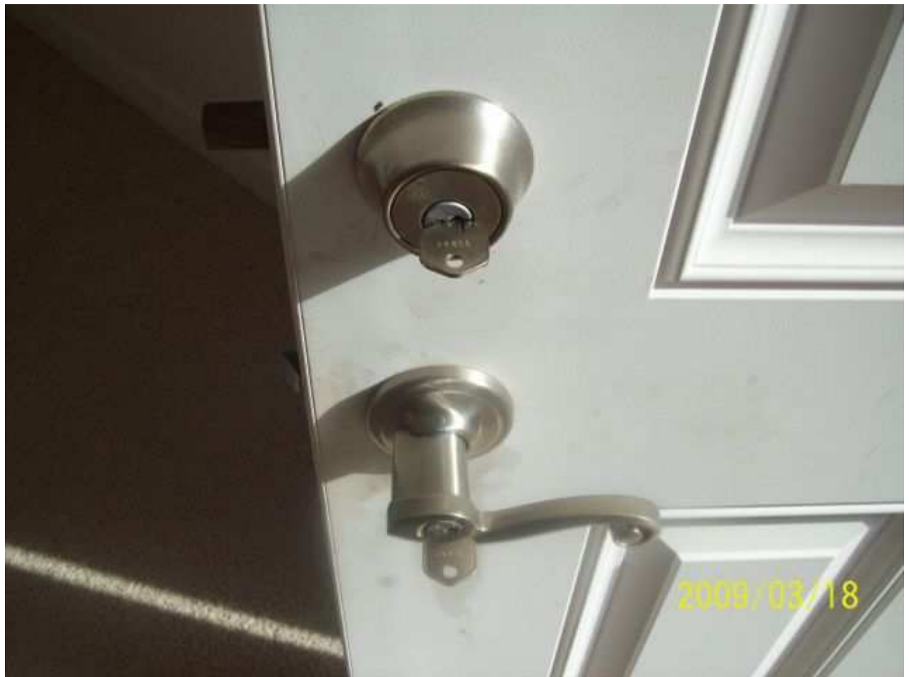
march18 jody 149 [640x480].JPG