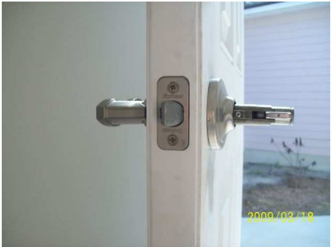
march18 jody 144 [640x480].JPG