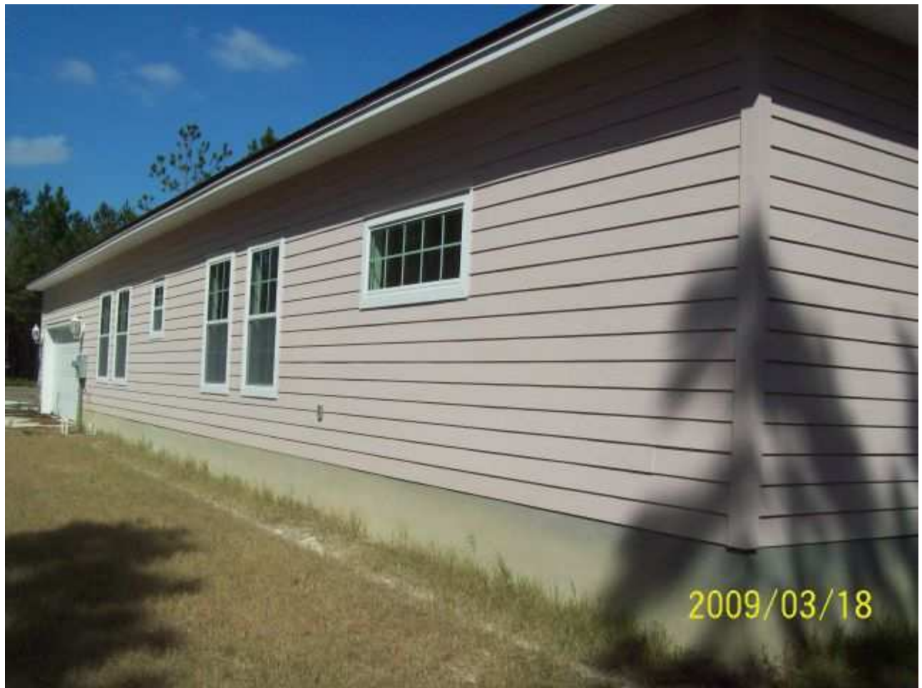
march18 jody 032 [640x480].JPG