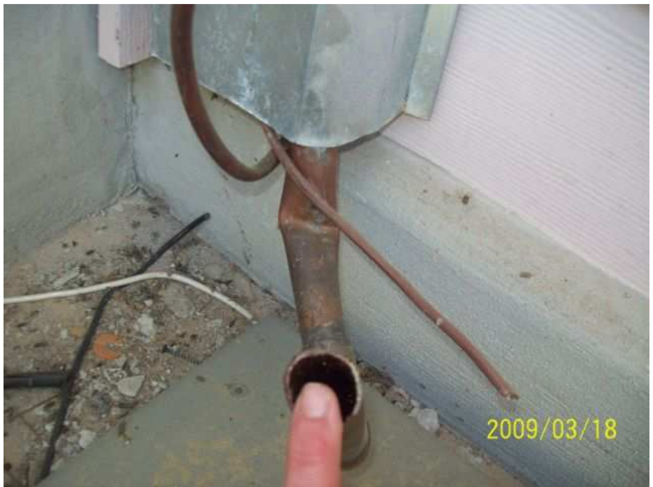
march18 jody 054 [640x480].JPG