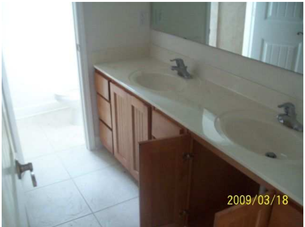
march18 jody 202 [640x480].JPG