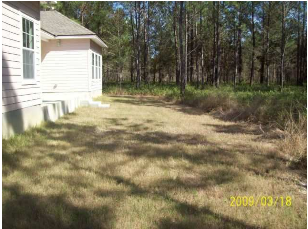
march18 jody 030 [640x480].JPG