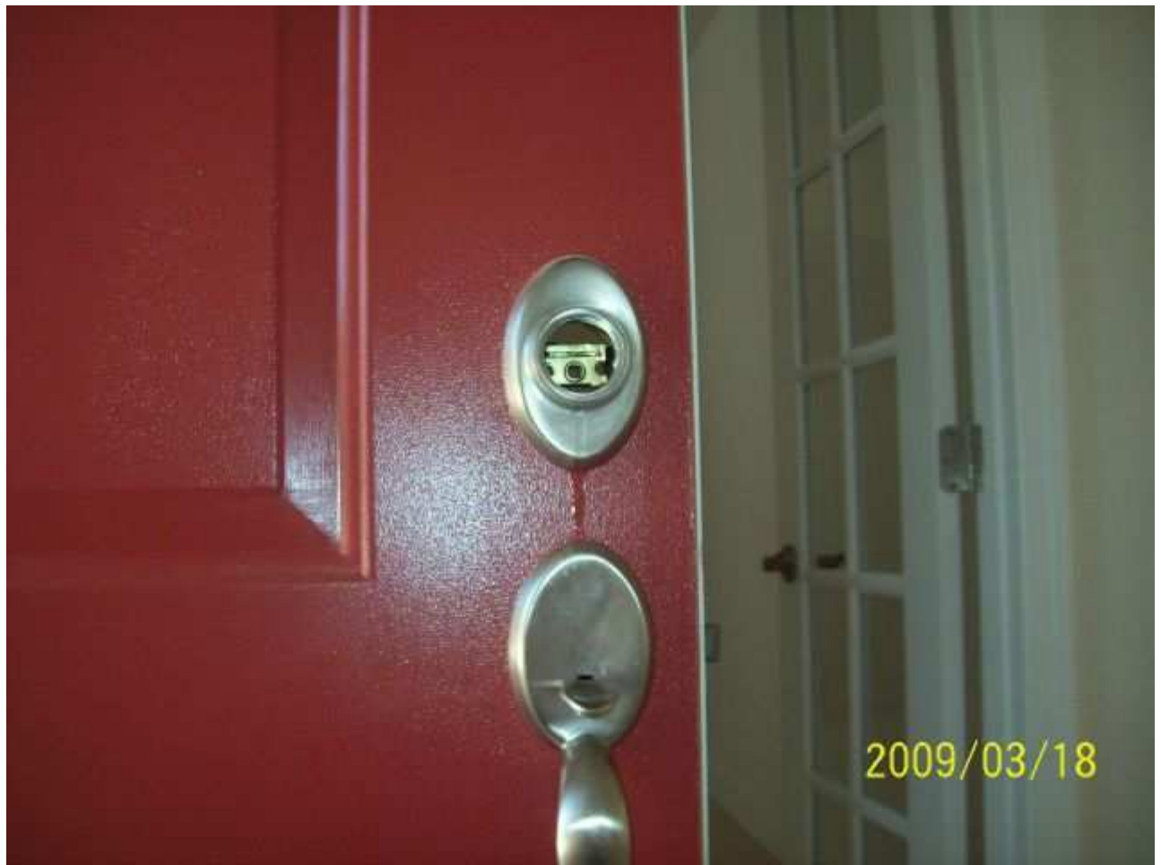
march18 jody 119 [640x480].JPG