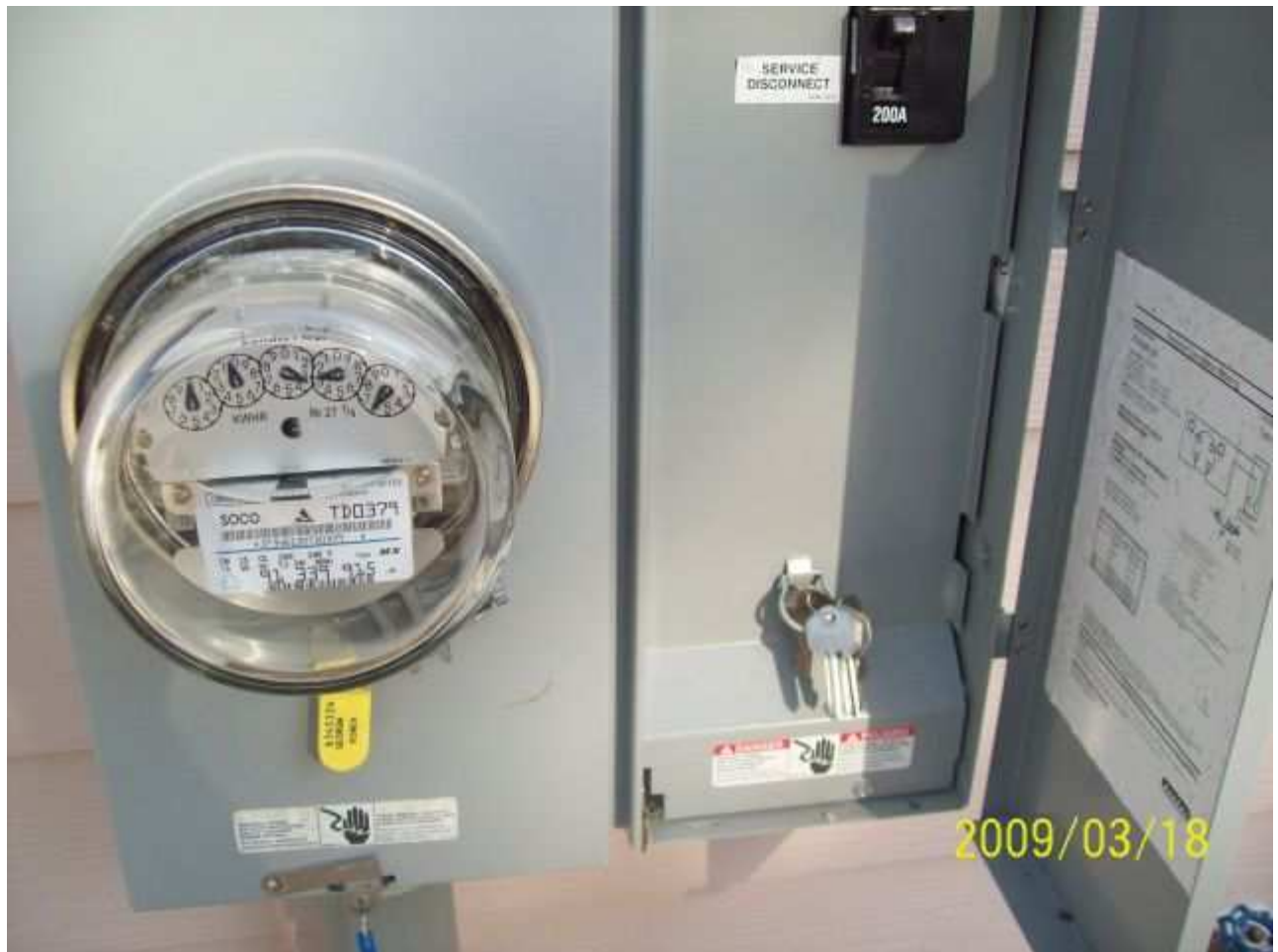
march18 jody 253 [640x480].JPG