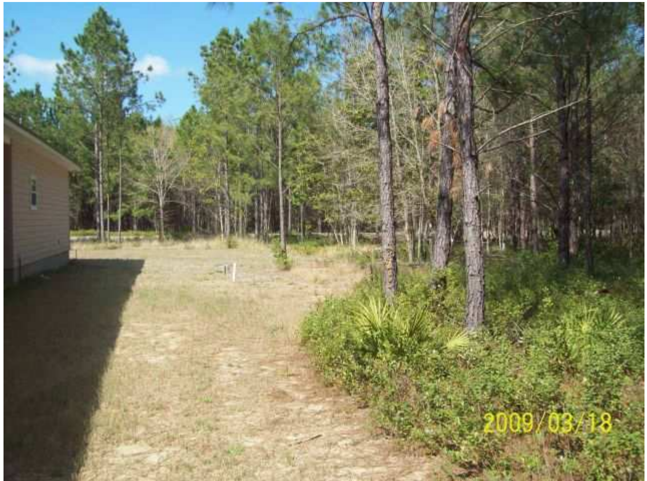
march18 jody 048 [640x480].JPG