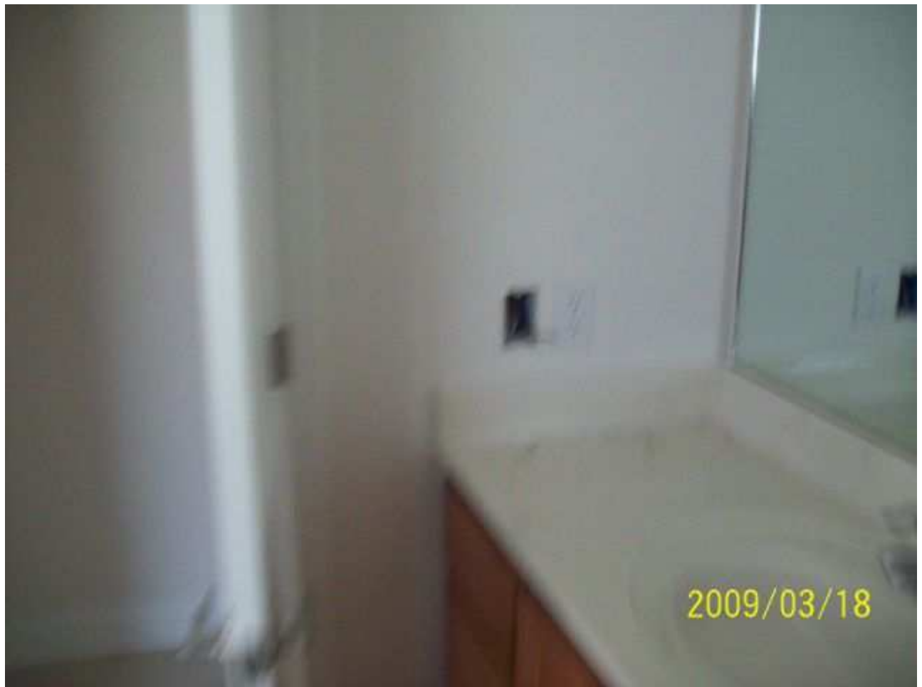
march18 jody 242 [640x480].JPG