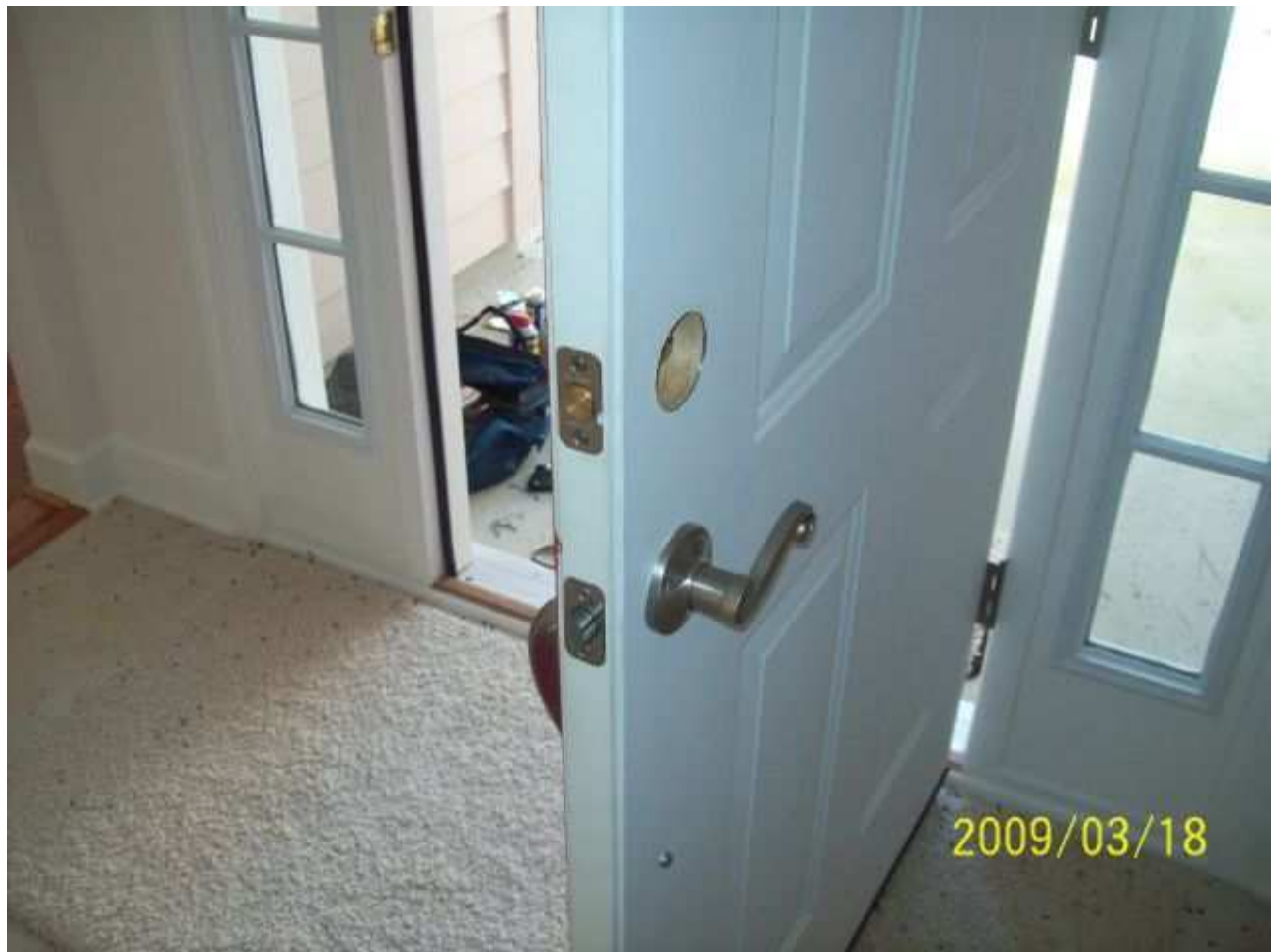
march18 jody 121 [640x480].JPG