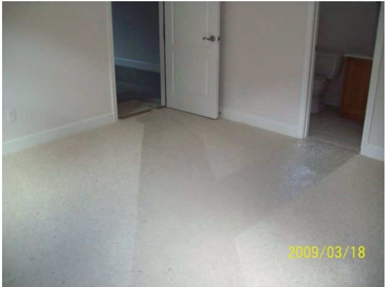
march18 jody 153 [640x480].JPG