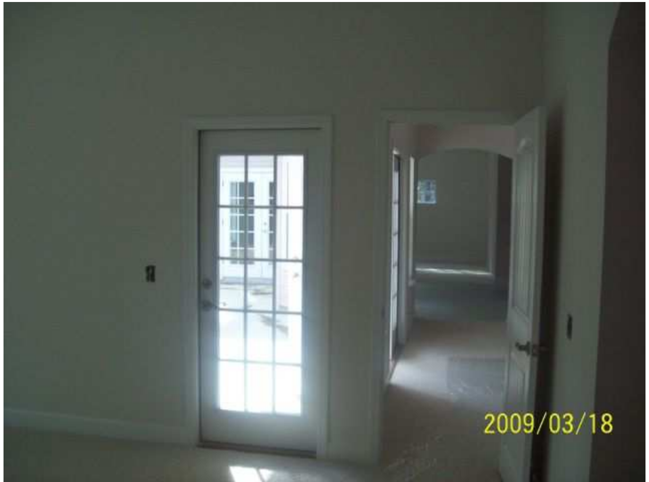
march18 jody 194 [640x480].JPG