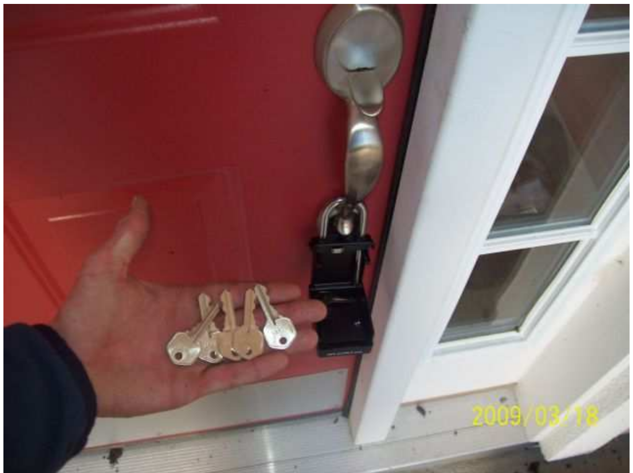
march18 jody 252 [640x480].JPG