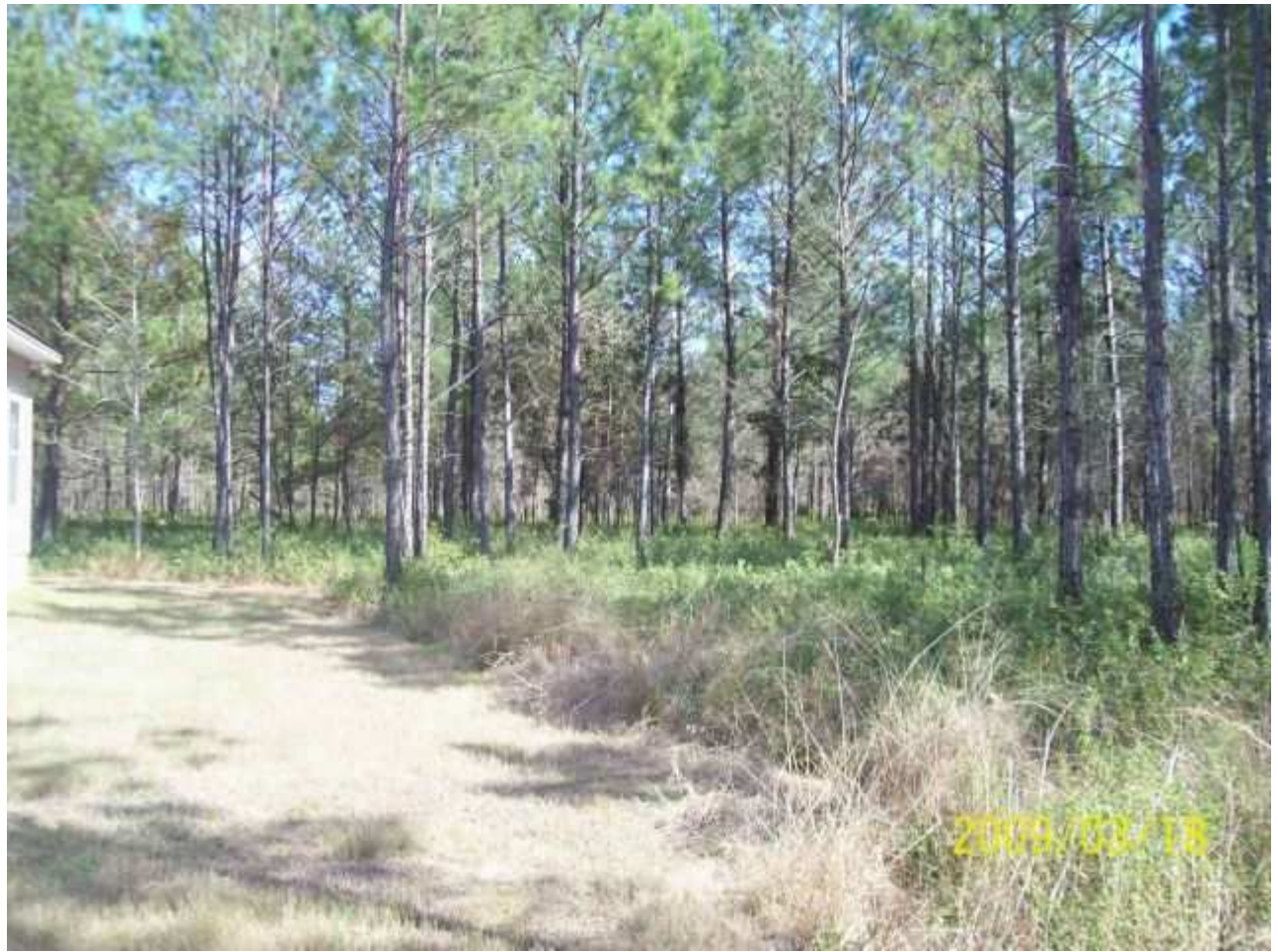
march18 jody 033 [640x480].JPG