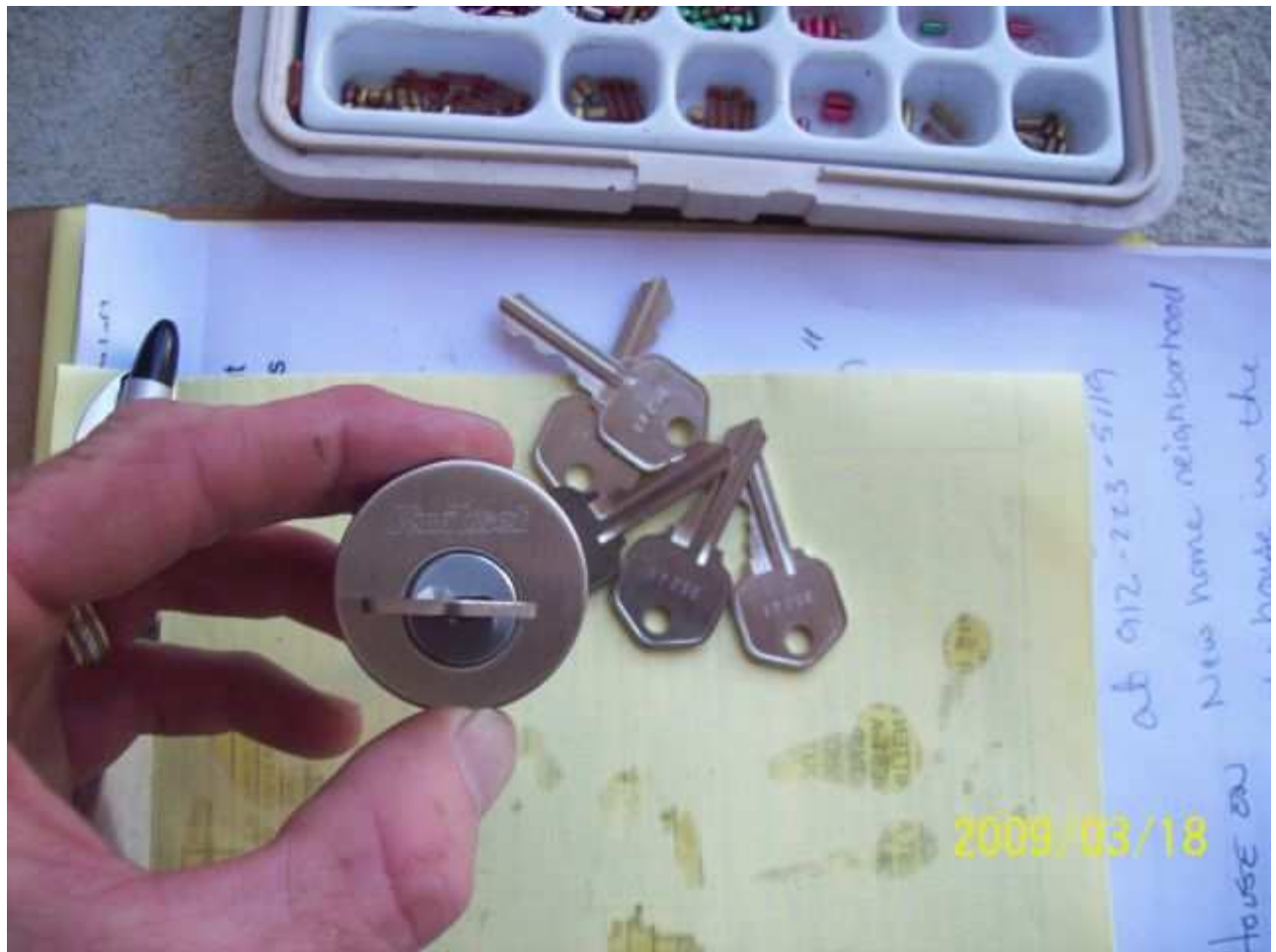
march18 jody 124 [640x480].JPG