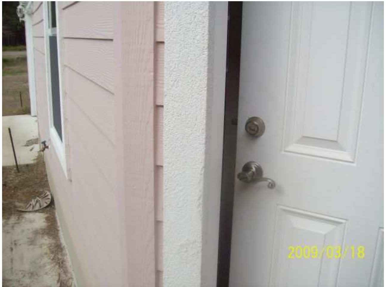
march18 jody 151 [640x480].JPG