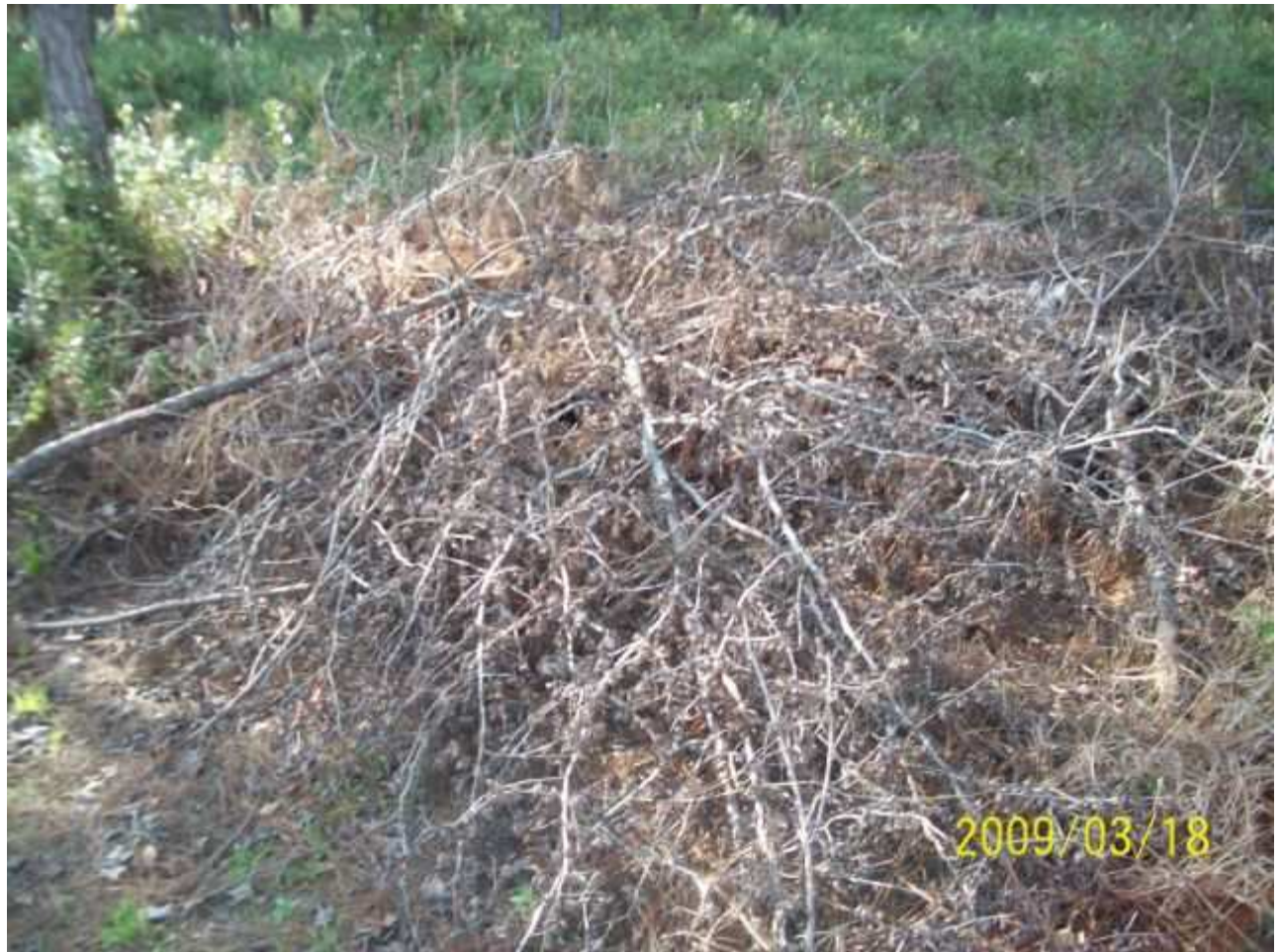
march18 jody 220 [640x480].JPG