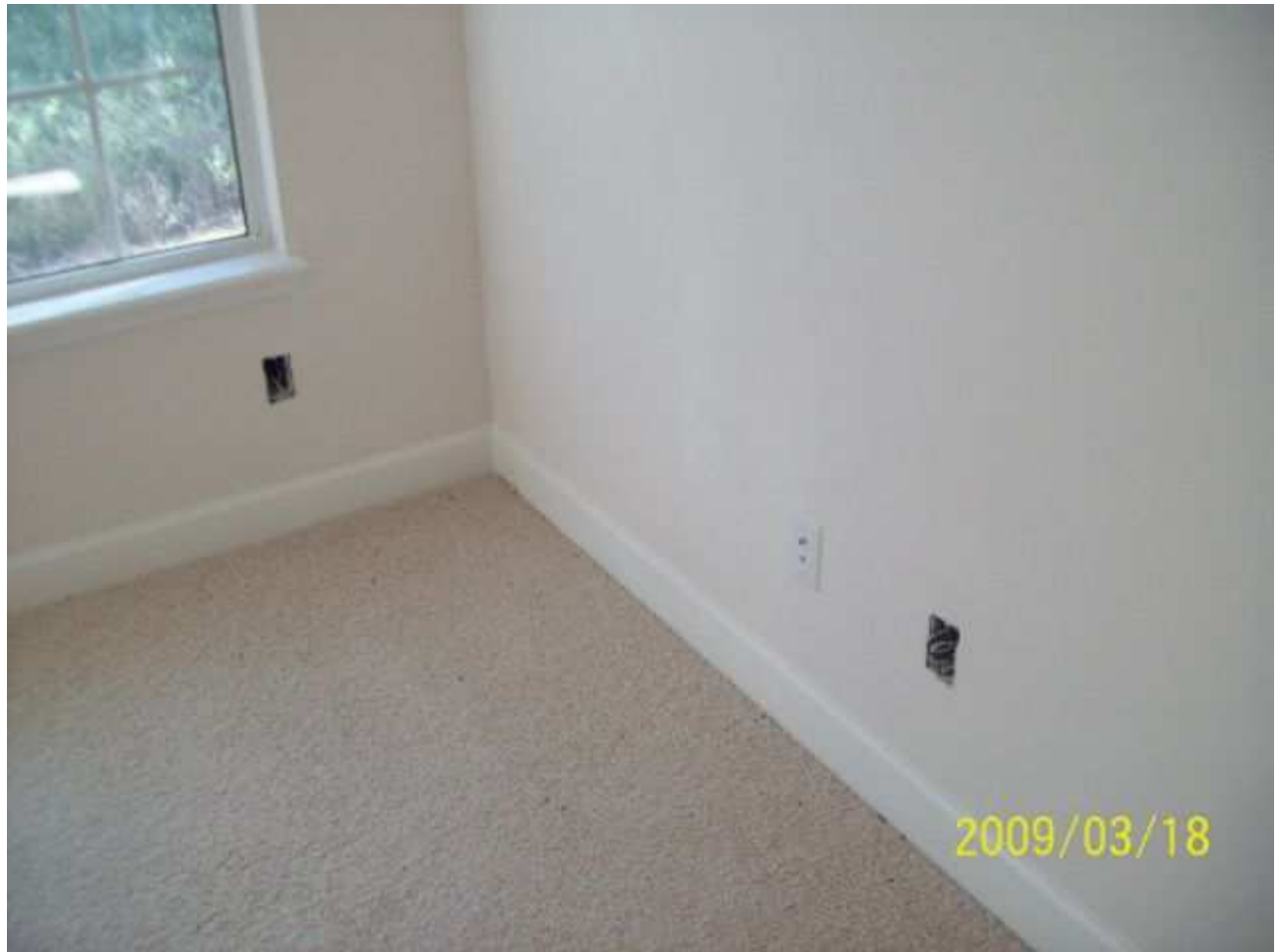
march18 jody 235 [640x480].JPG