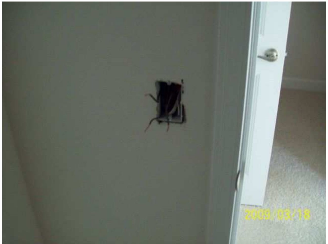
march18 jody 241 [640x480].JPG