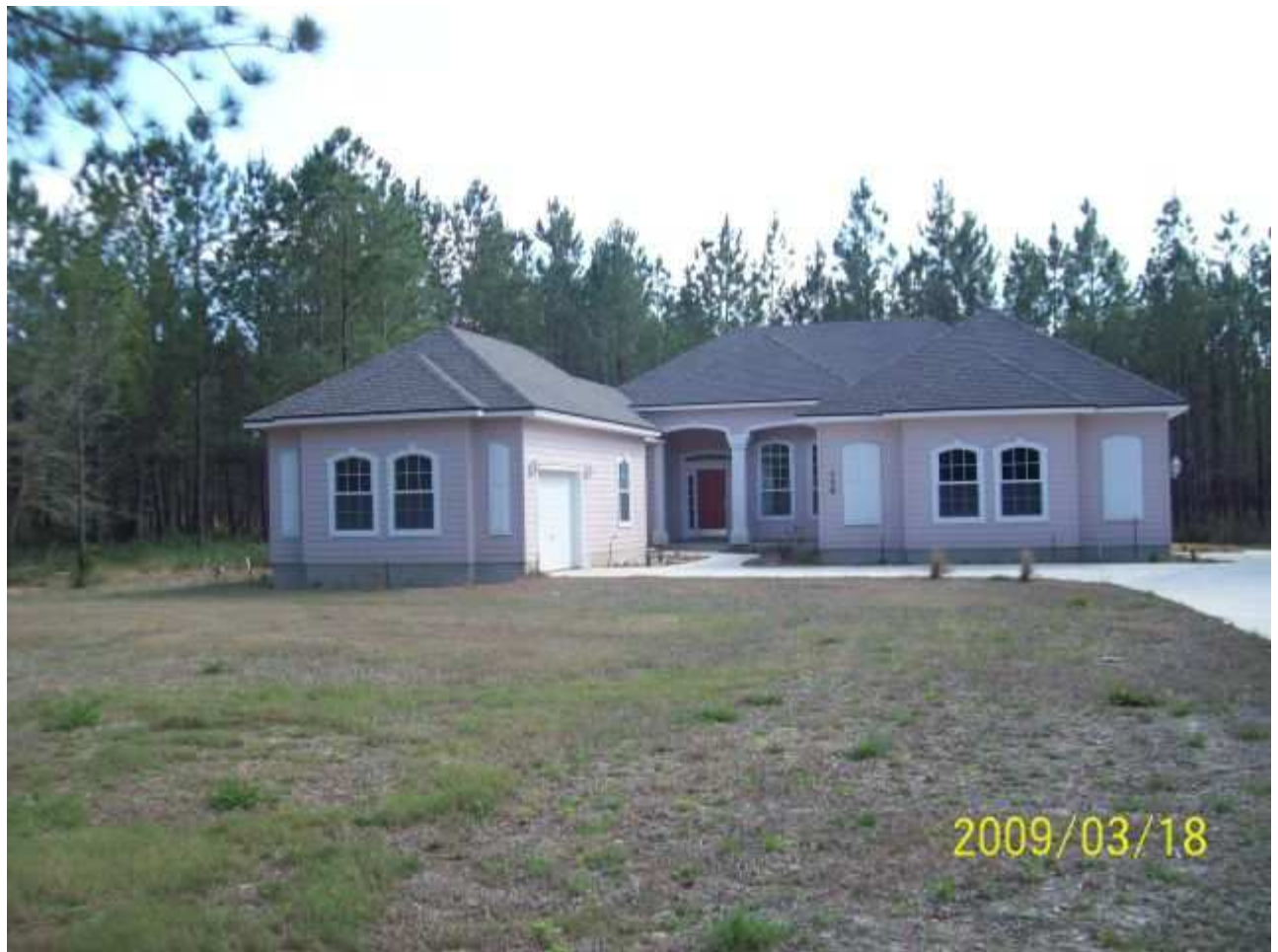
march18 jody 089 [640x480].JPG