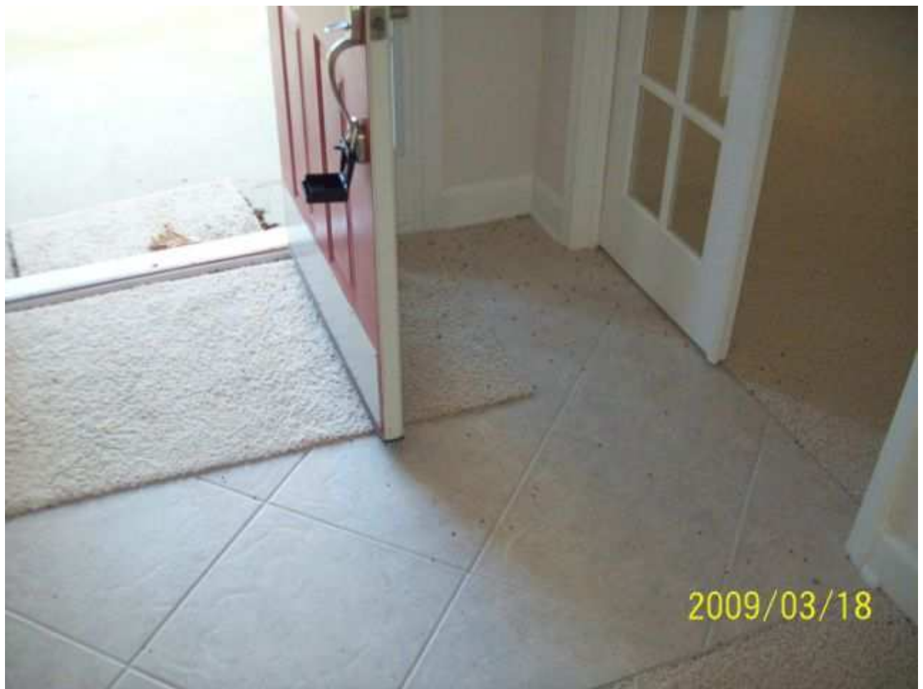
march18 jody 248 [640x480].JPG