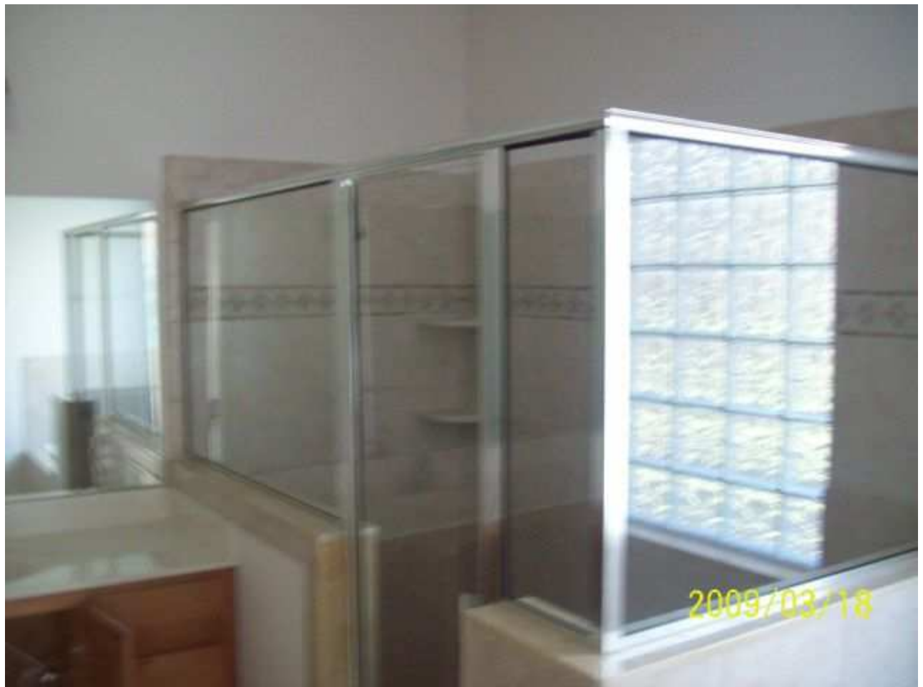
march18 jody 246 [640x480].JPG