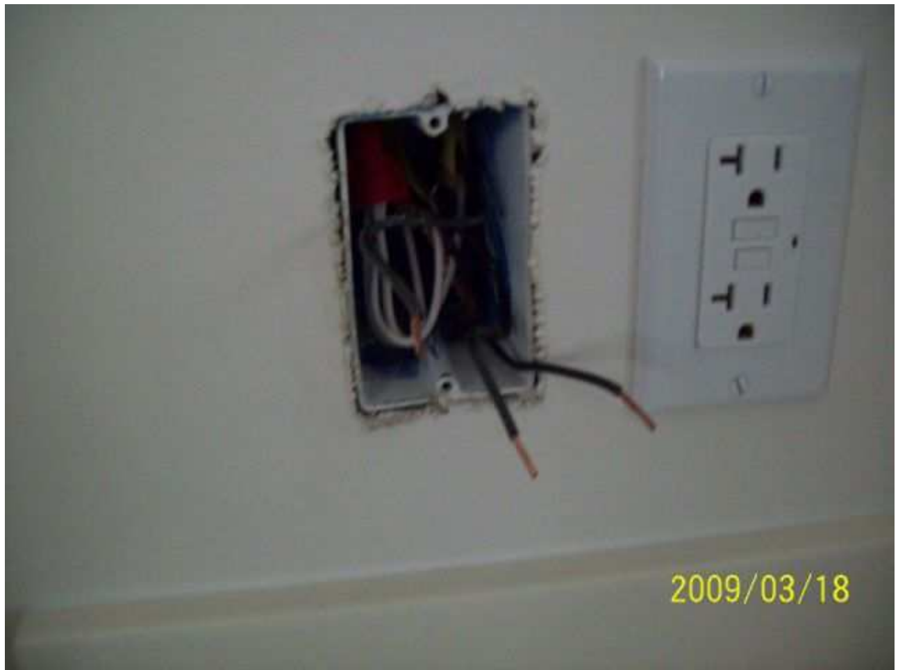
march18 jody 243 [640x480].JPG