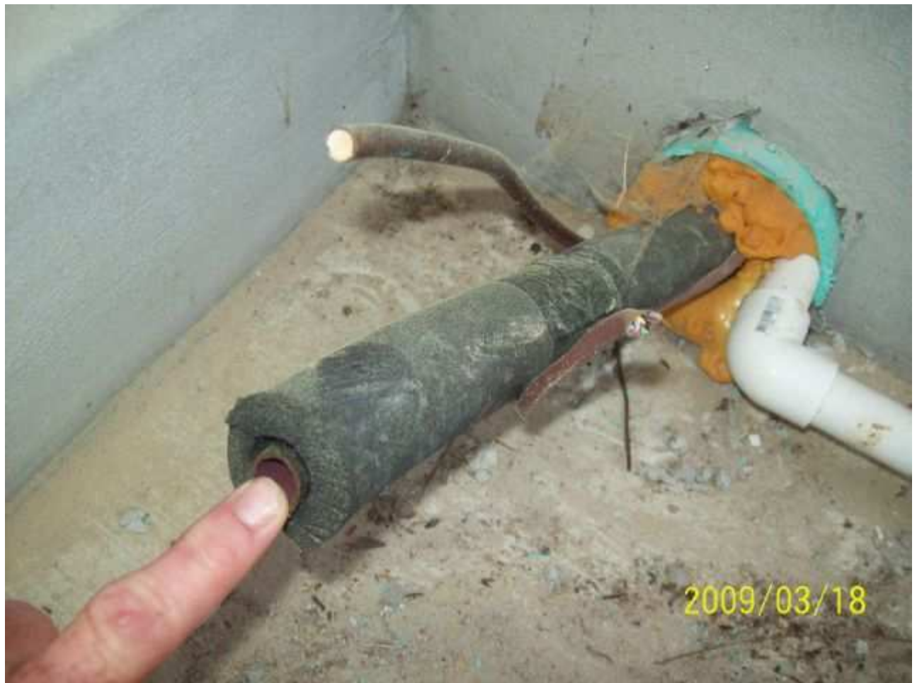
march18 jody 066 [640x480].JPG