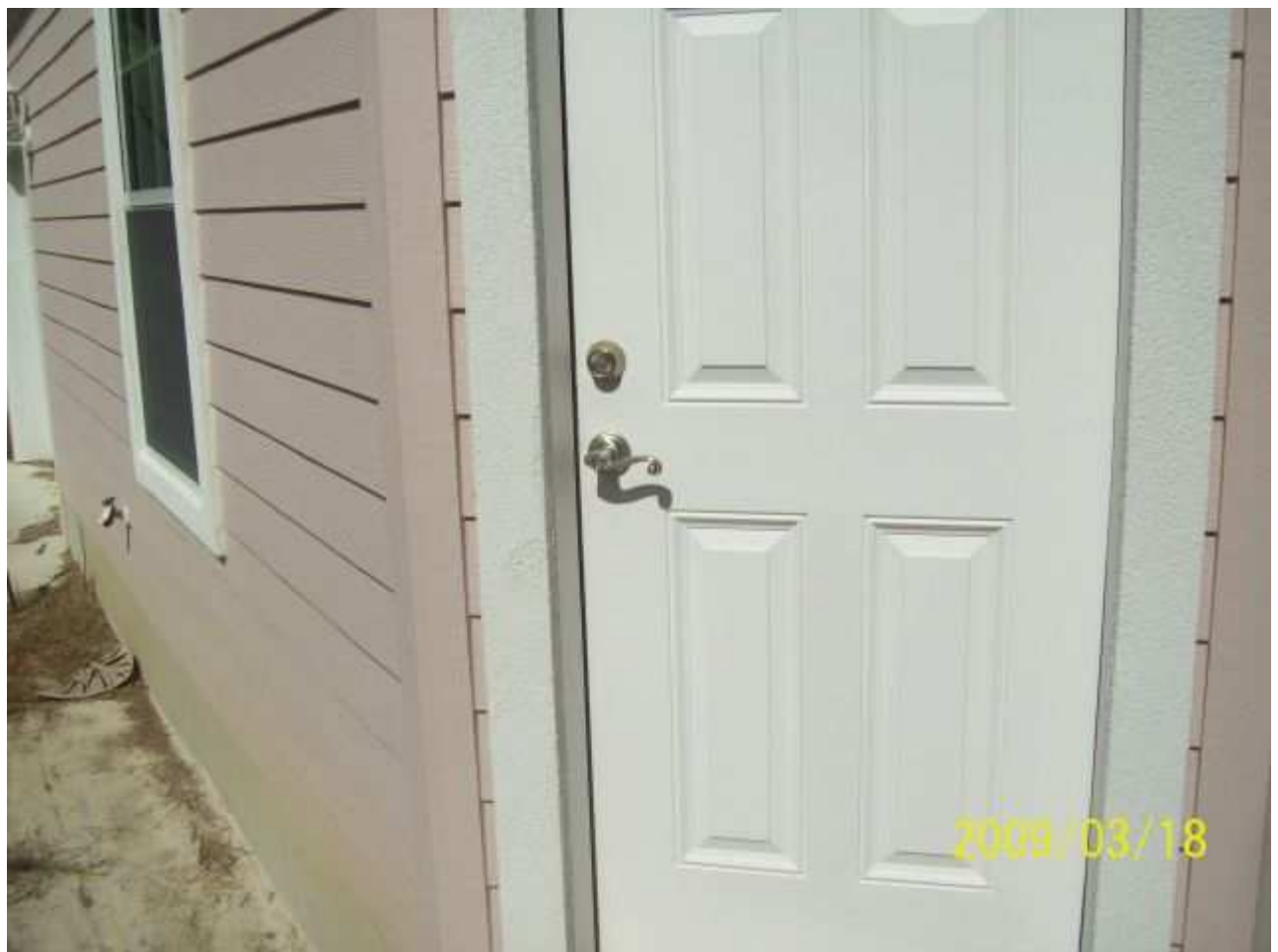
march18 jody 106 [640x480].JPG