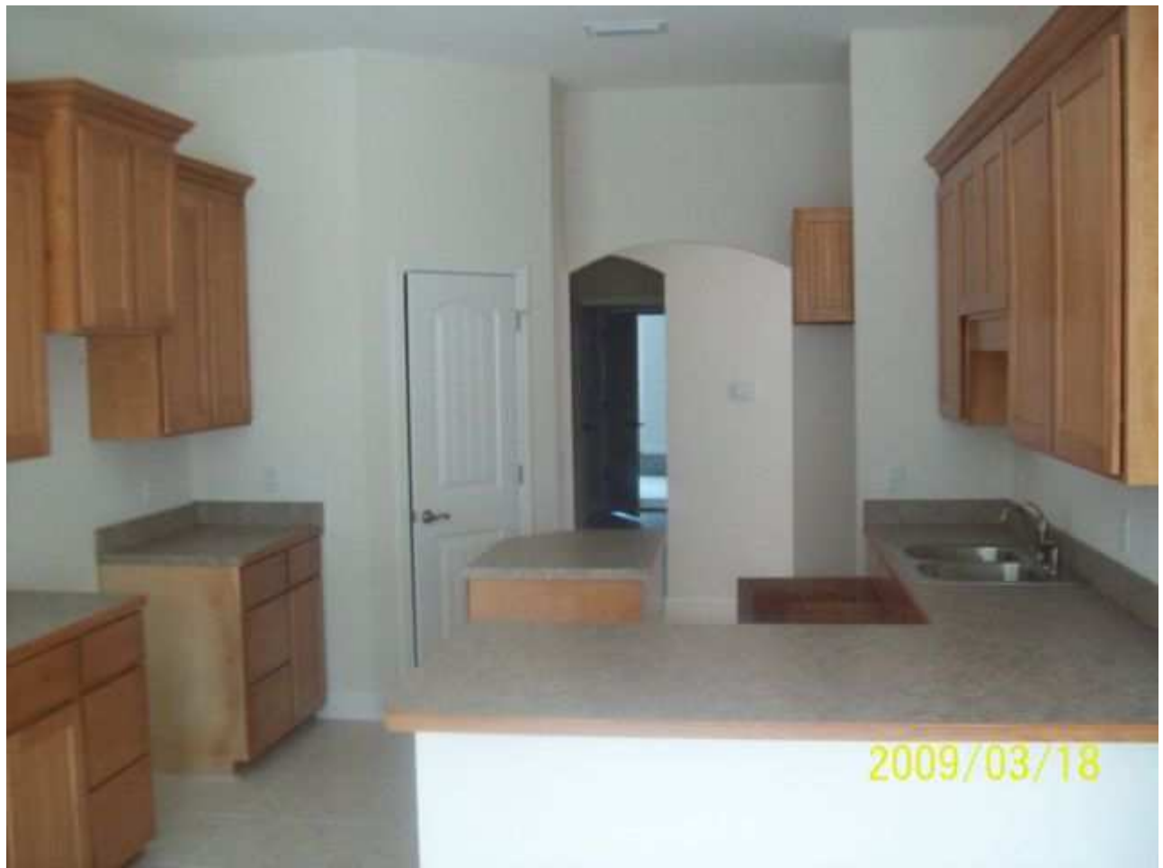
march18 jody 183 [640x480].JPG