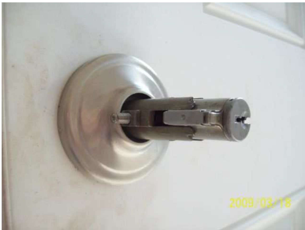
march18 jody 143 [640x480].JPG