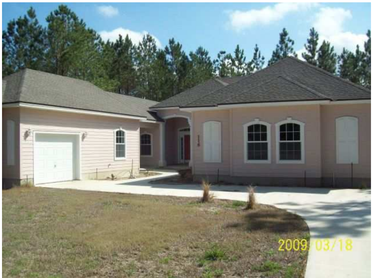
march18 jody 014 [640x480].JPG