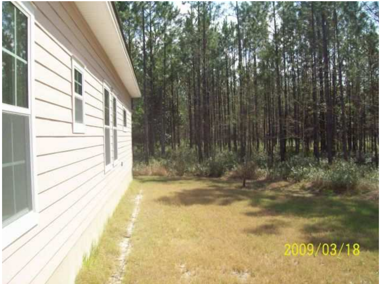
march18 jody 027 [640x480].JPG