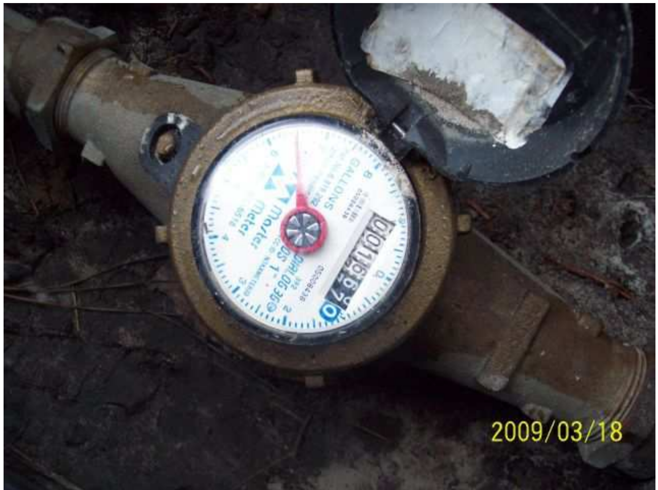
march18 jody 216 [640x480].JPG