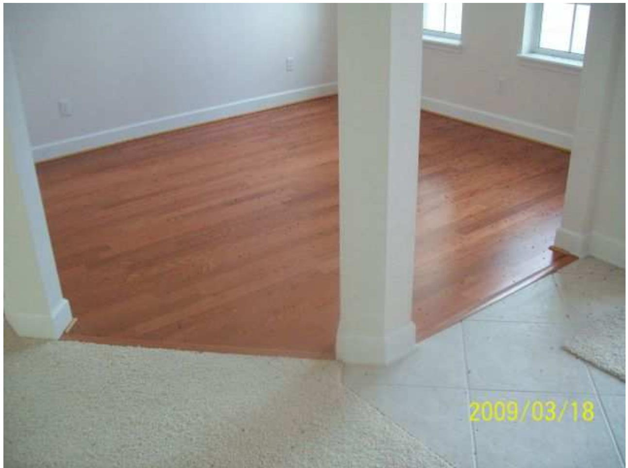
march18 jody 175 [640x480].JPG