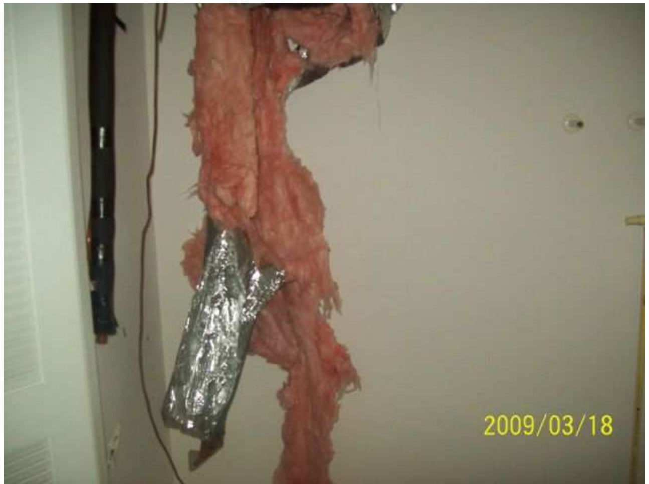
march18 jody 213 [640x480].JPG