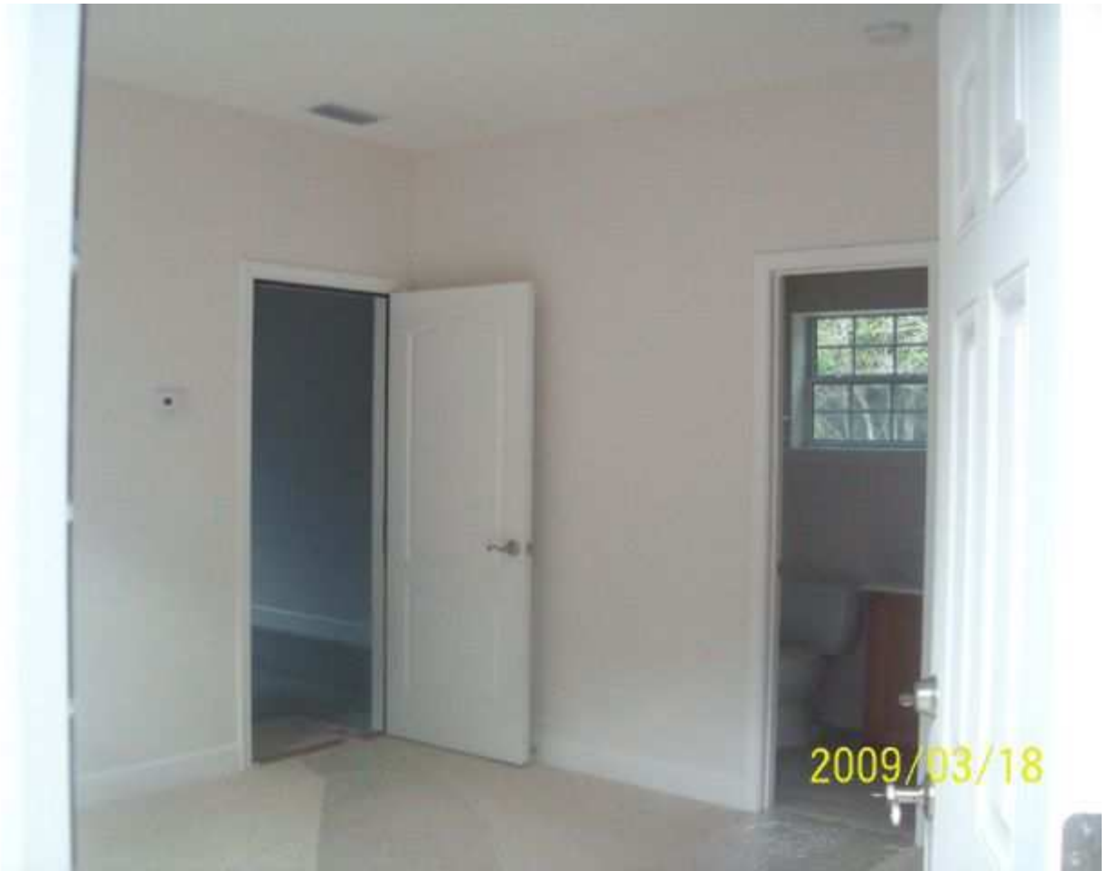
march18 jody 152 [640x480].JPG