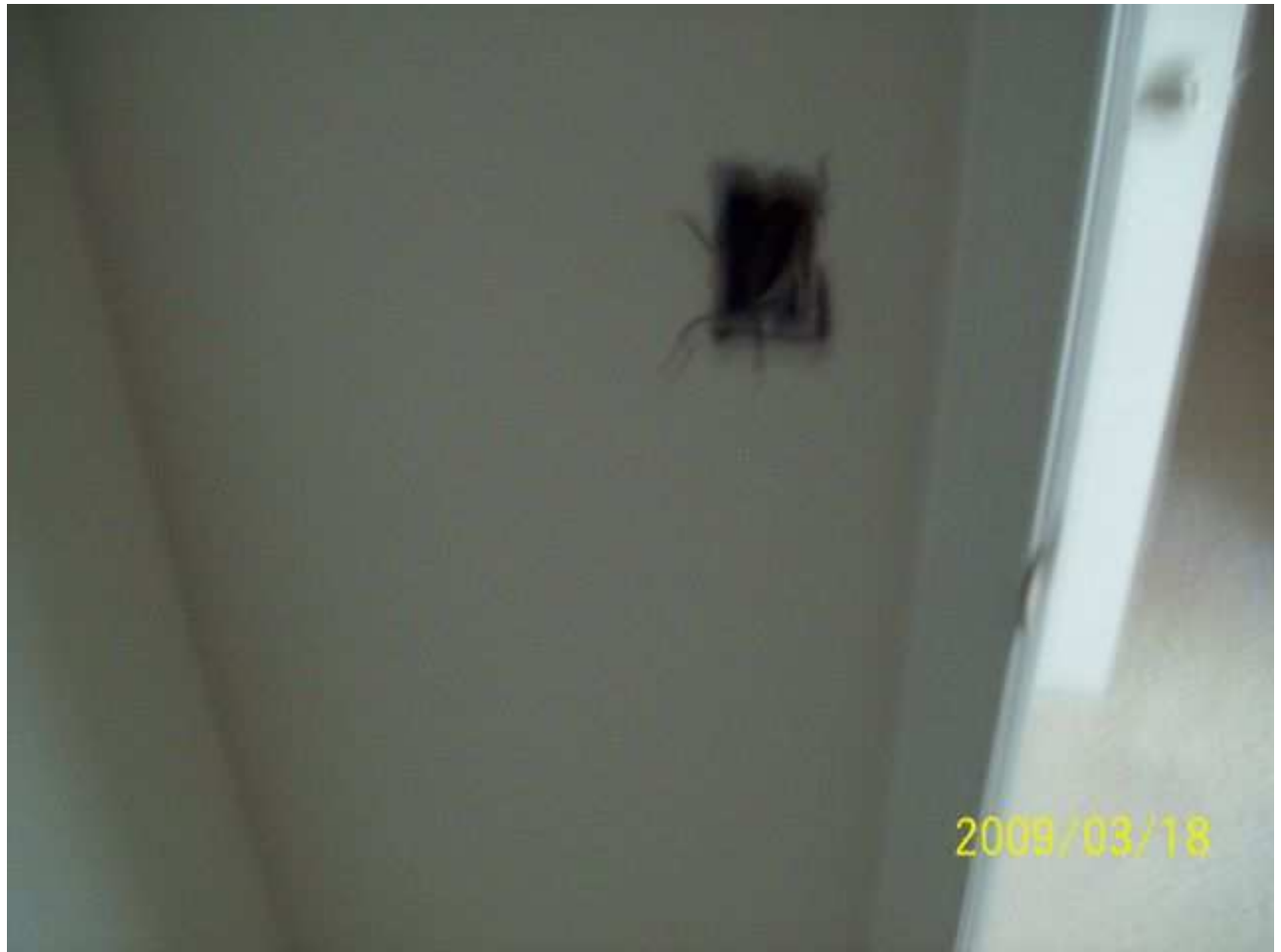
march18 jody 240 [640x480].JPG