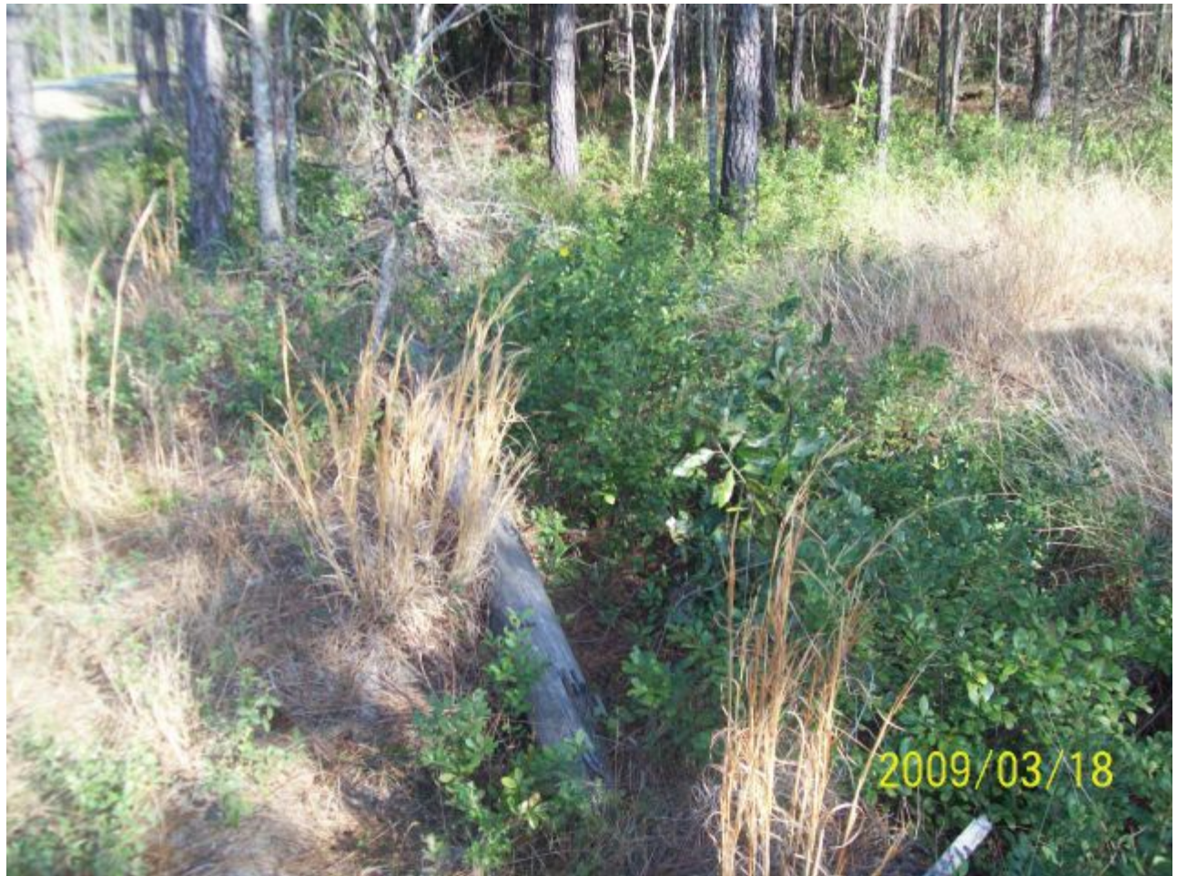
march18 jody 225 [640x480].JPG