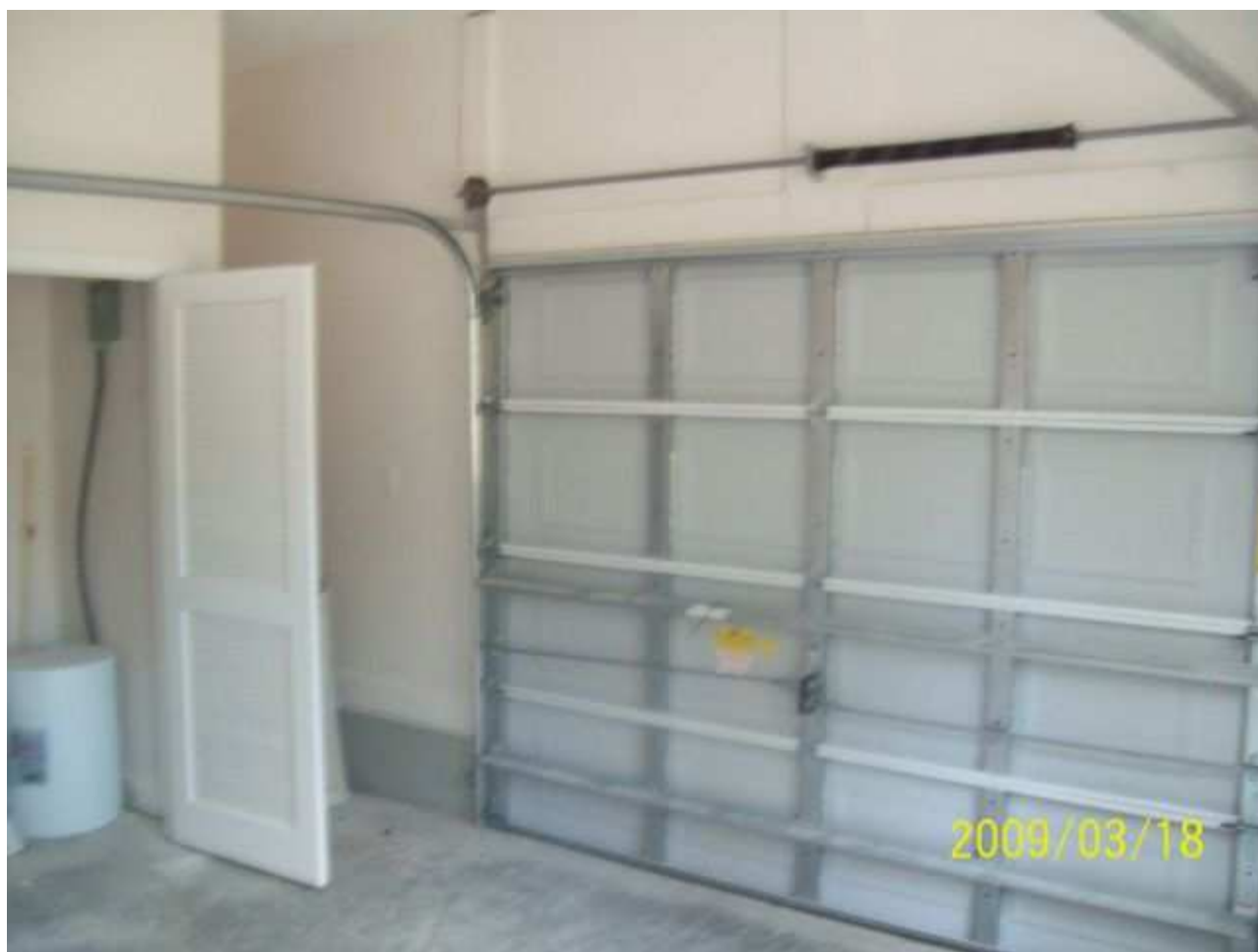
march18 jody 157 [640x480].JPG